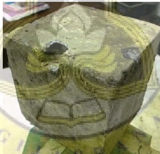
Gambar LV - 2 Netto