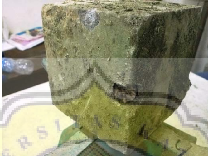
Gambar LV - 1 Bruto