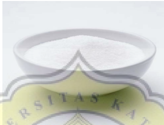
Gambar LII - 6 Sukrosa