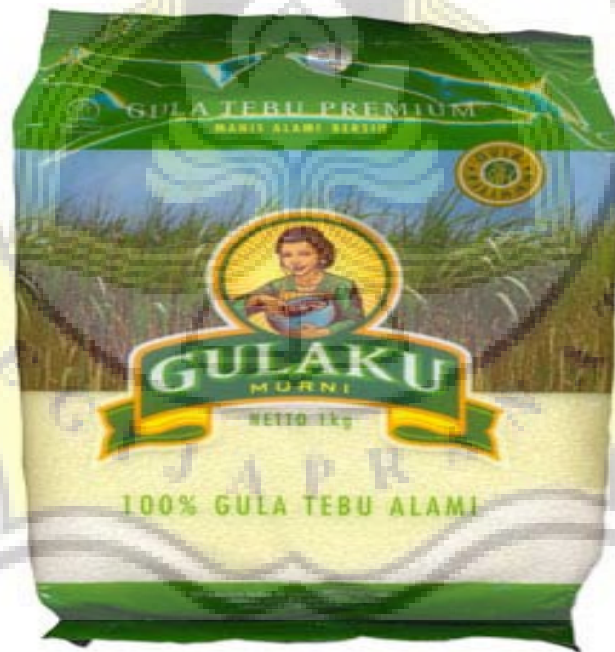
Gambar LII - 7 Gula Pasir