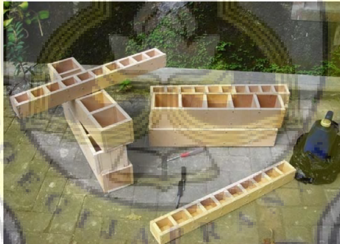
Gambar LIII - 4 Bekisting