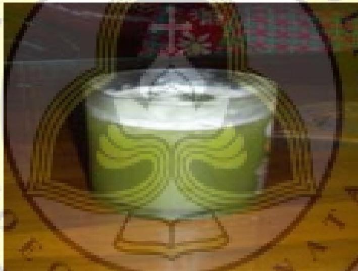
Gambar LII - 5 Larutan Tebu