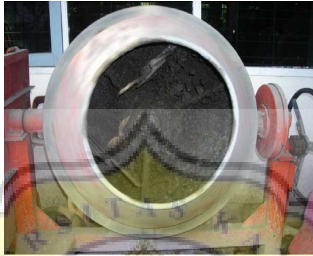
Gambar LIII - 3 Concrete Mixer