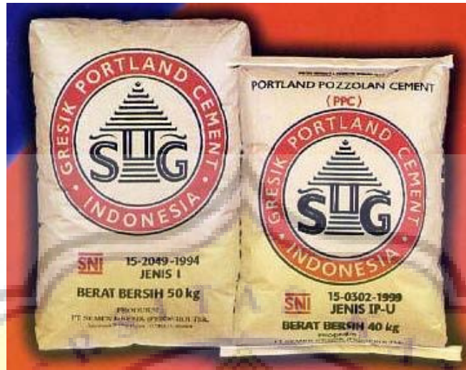
Gambar LII - 1 Semen