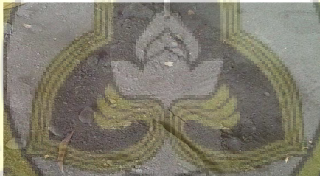
Gambar LII - 2 Pasir