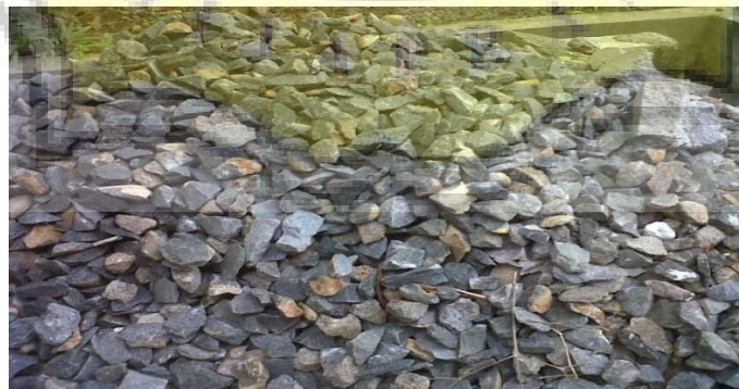
Gambar LII - 3 Kerikil