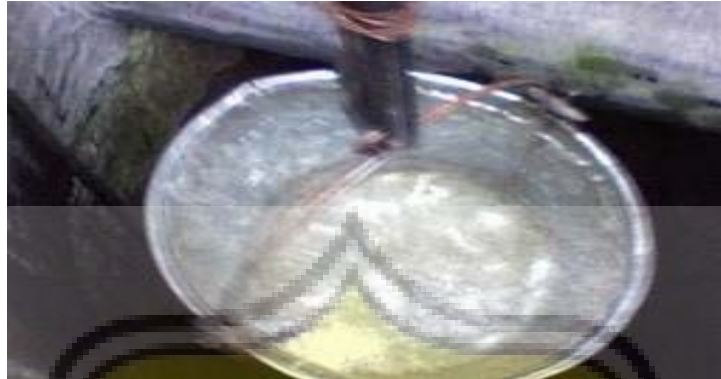
Gambar LII - 4 Air