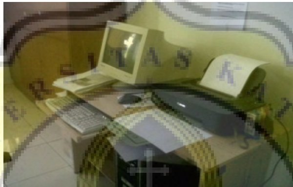
Foto pelatihan internet di SMK2 Kendal pada tanggal 14 September 2012

Foto satu unit komputer bantuan TELKOM untuk Balai Desa Limbangan