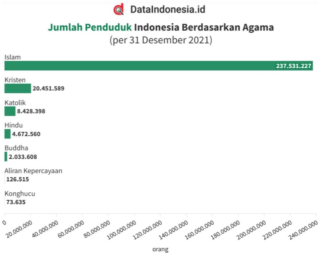
Gambar 1. Jumlah Penduduk Indonesia Berdasarkan Agama (per 31 Desember 2021)

Secara statistik jumlah penganut agama Khonghucu di Indonesia per Bulan Desember 2021 adalah sebesar 0,03% dari total populasi atau sejumlah 73.635 jiwa. Berikut adalah gambar jumlah statistik pemeluk agama di Indonesia berdasarkan data dari Kementerian Dalam Negeri yang disarikan oleh DataIndonesia.id: