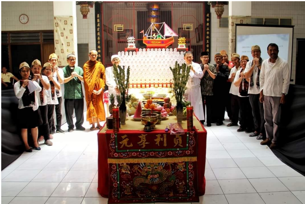
Gambar 3. Altar khusus yang dibuat untuk sembahyang King Hoo Ping di halaman gedung Boen Hian Tong atau Perkumpulan Rasa Dharma

Sembahyang King Hoo Ping merupakan ritual sembahyang penghormatan arwah yang dilakukan oleh umat Khonghucu pada setiap akhir bulan ketujuh penanggalan Kongzili yaitu bulan Jit Gwe. Umat Khonghucu percaya bahwa pada bulan Jit Gwe para arwah diberi kesempatan untuk turun ke dunia guna menengok para anak, cucu, dan sahabat. Sebagai salah satu upacara ritual yang sakral, umat Khonghucu melakukan sembahyang King Hoo Ping dengan tujuan untuk menghormati arwah para leluhur, sahabat, dan umat pada umumnya agar para arwah tersebut merasa tenang dan damai di alam keabadian. Guna melakukan ritual sembahyang Kong Hoo Ping tersebut maka umat Khonghucu akan membuat altar secara khusus yang diletakkan di halaman klenteng atau rumah abu (Matakin, 2015).