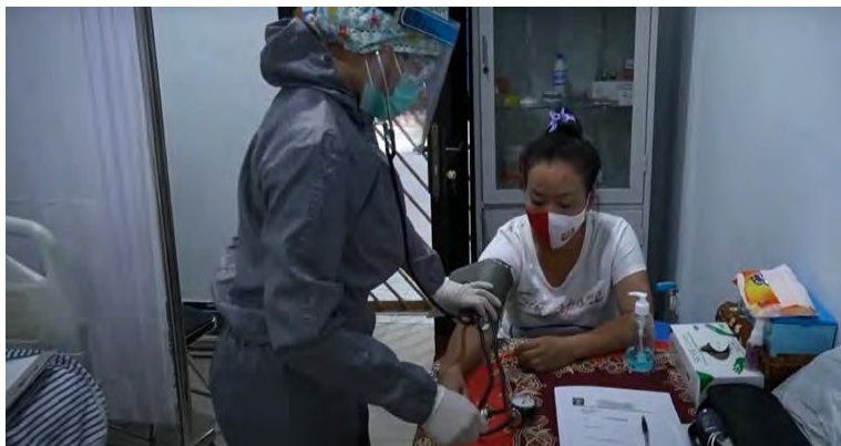
Gambar 4. Fasilitas Pemeriksaan Kesehatan bagi Deteni