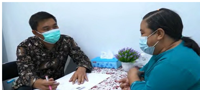
Gambar 6. Pemeriksaan Kesehatan Psikologis Deteni

Layanan psikologi ini merupakan bagian dari layanan kesehatan jiwa karena sebagian besar para deteni mengalami 'kesendirian' jauh dari keluarga, meskipun di dalam Rudenim mereka memiliki teman yang 'senasib'. Akan tetapi kedekatan secara fisik dengan para Deteni tentunya tidak sama dengan keluarga atau saudara-saudara mereka yang berada di negara asal. Melalui layanan psikologi, mereka dapat mengungkapkan perasaan atau kegundahan yang dialami selama di Rudenim Semarang.