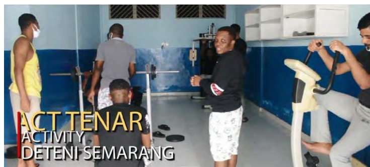
Gambar 2. Ruang Olahraga Deteni dan Jadwal Kegiatan Deteni

Inovasi ini dibuat untuk memudahkan Deteni dalam melakukan aktivitas atau kegiatan setiap harinya, termasuk kegiatan olah raga dalam rangka menjaga kesehatan. Untuk kegiatan olah raga deteni, pihak Rudenim menyediakan waktu-waktu khusus dan peralatan khusus olah raga, termasuk sarana olah raga berupa lapangan volley, ring basket, peralatan angkat beban (fitness), dan meja serta peratan tenis meja (ping-pong). Berikut adalah gambar ruang fasilitas taman dan olah raga bagi para Deteni: