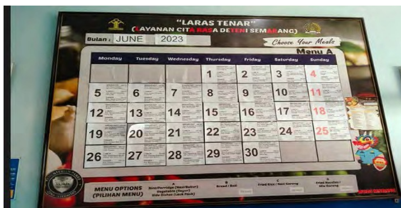
Gambar 5. Fasilitas Menu untuk Menjamin Kesehatan Deteni

Layanan Inovasi ini memuat daftar menu makan Deteni setiap harinya dan tertuang dalam papan menu Deteni yang memuat daftar menu dalam satu bulan dan bisa diakses langsung oleh Deteni. Layanan ini diakomodir oleh Seksi Keperawatan dan Kesehatan. Berikut adalah layanan laras tenar yang dipasang di dinding dekat Blok Deteni. Pemasangan menu makan untuk mengantisipasi kebosanan para deteni. Dengan mengetahui menu tersebut maka mereka dapat memilih menu makanan yang diinginkan berdasarkan jadwal penyediaannya.