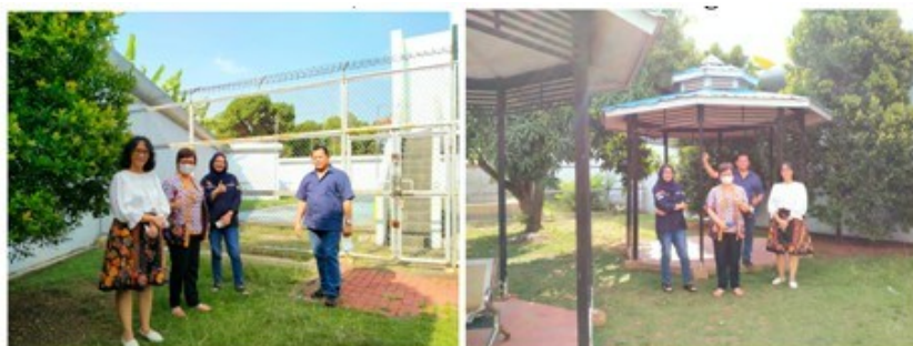
Gambar 1. Taman, Gazebo dan Sarana Olahraga Outdoor

Layanan ini bertujuan untuk menjadikan Rumah Detensi Imigrasi menjadi tempat yang lebih eco-friendly atau ramah lingkungan. Area di sekitar Blok tempat Deteni ditempatkan telah dirancang dengan baik dengan mempertimbangkan kepentingan atas kesehatan deteni. Upaya menyediakan ruang/tempat yang sehat dilakukan dengan menyediakan lapangan dan sarana olah raga, taman, dan teras. Di Rudenim tersedia pula fasilitas air bersih dan Mushola yang dapat digunakan untuk beribadah. Setiap hari Kamis diadakan acara doa bersama para Deteni. Berikut adalah gambar Taman dan Sarana Olah Raga: