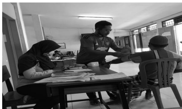
Gambar 3.1: Kegiatan Pelayanan Kesehatan

Pelayanan kesehatan pada narapidana tentunya adalah pelayanan yang berkaitan dengan pelaksanaan hak-hak dan kewajiban yang mana berupa perawatan, pembinaan, pendidikan, dan bimbingan. Hal ini sangat sia-sia ketika adanya fasilitas ruang kesehatan, obat-obatan tapi tidak di barengi dengan pelayanan yang di lakukan oleh petugas medis Lapas untuk itu adapun bentuk pelayanan yang di berikan oleh petugas Lembaga Pemasyarakatan Kelas IIA Ambarawa di mulai dengan melakukan pengontrolan ke setiap kamar-kamar narapidana lansia.