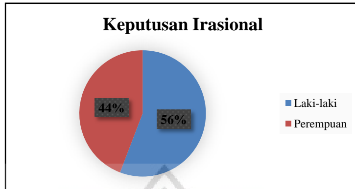
Gambar 4.3 Proporsi Keputusan Irasional Berdasarkan Gender

Pada gambar 4.3 menjelaskan hasil proporsi dari kontribusi konsumen yang gemar melakukan pembelian atas dasar keputusan irasional. Penghitungan proporsi tersebut menggunakan teknik Top 2 Boxes, di mana responden yang menjawab pilihan jawaban 3 dan 4 dijumlah dan diklasifikasikan berdasarkan jenis kelamin. Oleh sebab itu 81 dari 100 responden dinyatakan melakukan keputusan pembelian atas dasar yang irasional dengan menunjukkan bentuk dukungan dan terpengaruh dengan adanya brand ambaasador Lee Min Ho , dan hal tersebut dipimpin oleh laki-laki (56%).