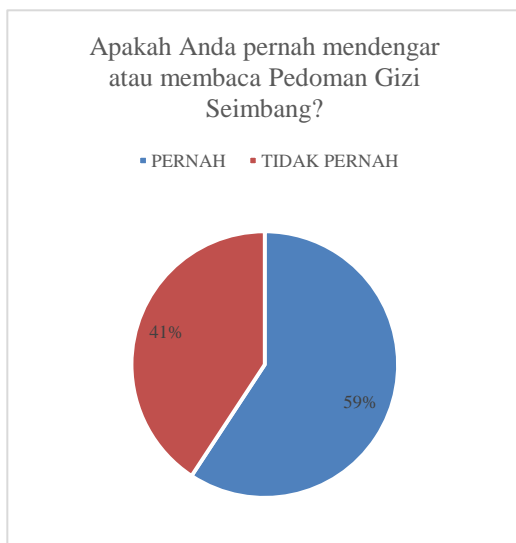
Gambar 8. Proporsi Pernah Tidaknya Peserta Mendengar Istilah “Pedoman Gizi Seimbang: Sebelum Kegiatan Ceramah dan Diskusi

Melalui pre-test, diketahui bahwa lebih dari separuh (59%) peserta belum pernah mendengar istilah Pedoman Gizi Seimbang. Kegiatan yang serupa dengan kegiatan pengabdian masyarakat ini dapat digunakan sebagai alat promosi kesehatan dengan mengenalkan dan menambah pengetahuan mengenai perilaku makan yang baik. Melalui peningkatan pengetahuan dan awareness terhadap Pedoman Gizi Seimbang, diharapkan adanya perbaikan kemandirian dalam memilih makanan dan perilaku makan pada kelompok usia remaja.