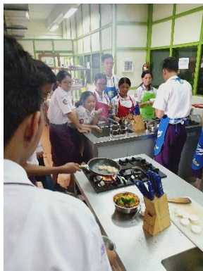
Gambar 7. Peserta Menumis Bahan pada Resep Sapu Tahu Seafood