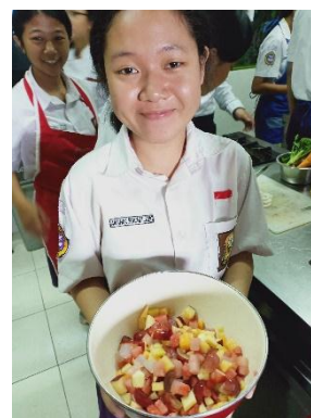
Gambar 5. Salad Buah yang Dibuat oleh Peserta