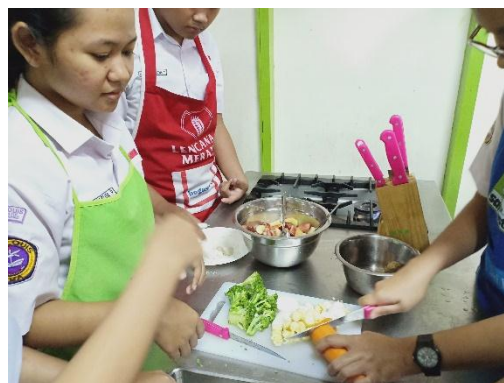
Gambar 6. Peserta Memotong Sayuran