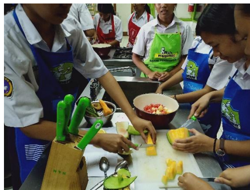
Gambar 4. Peserta Memotong Buah-buahan

dimasak, dan belajar mengenal teknik memasak sayur dan buah.