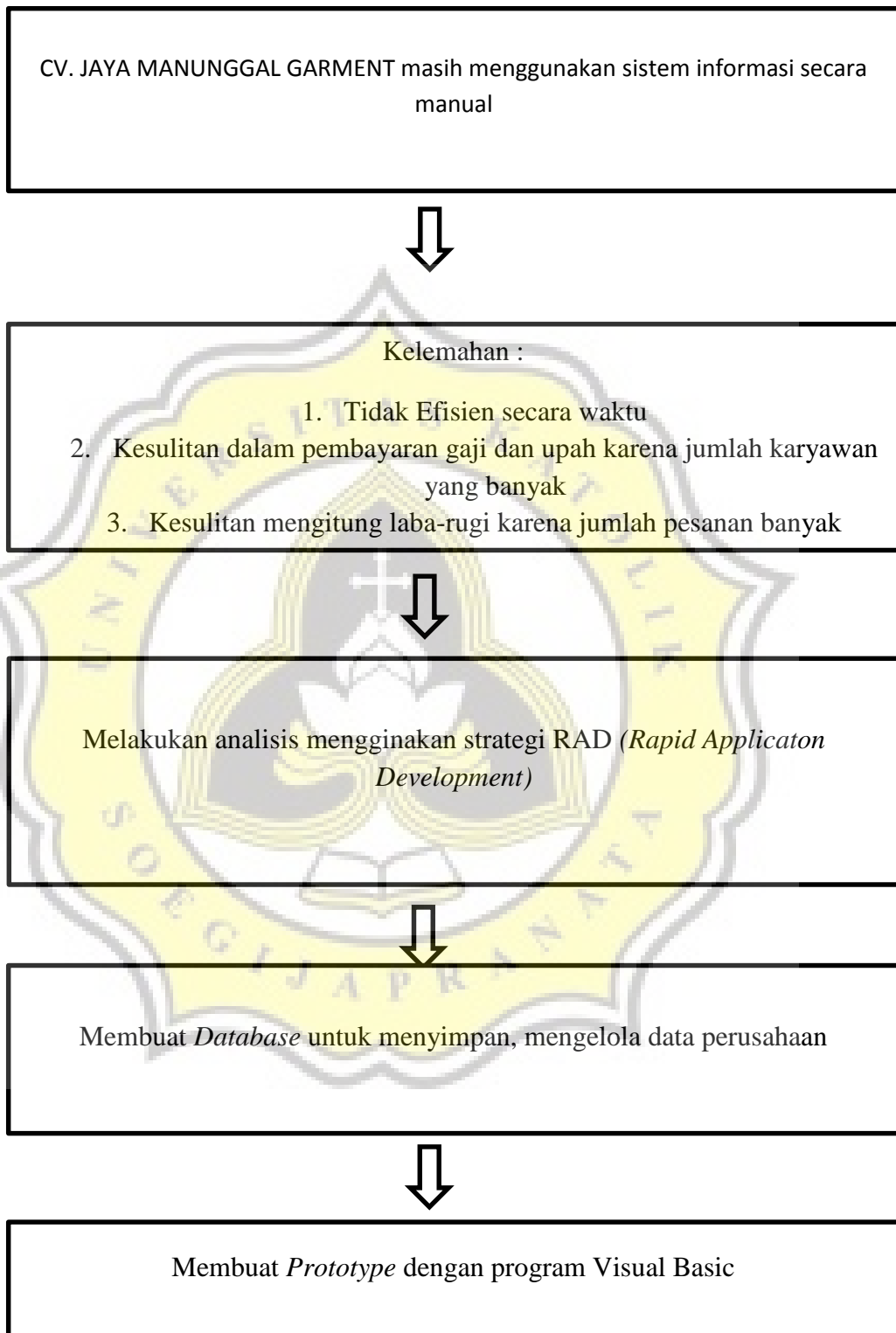
Gambar 1. 1 Kerangka Pikir