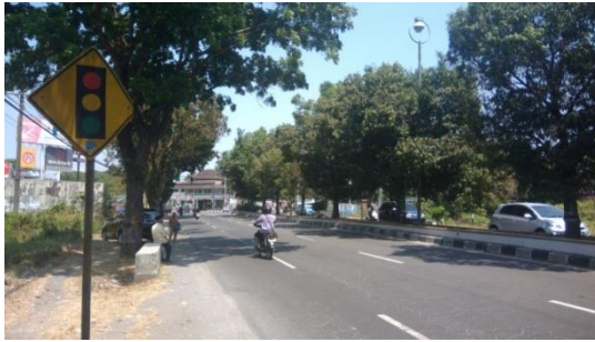
Gambar 4.4. akses pada area tapak