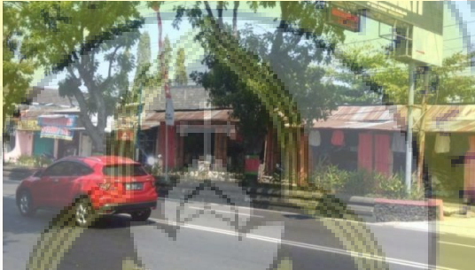
Gambar 4.5. Toko pada lingkungan sekitar tapak

Pada lingkungan sekitar tapak terdapat beberapa rumah yang membuka usaha perdagangan, seperti toko pakaian, toko sepatu, rumah makan, tempat laundry, warung dan lain-lain.