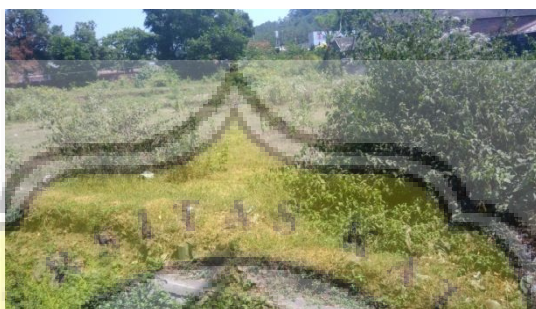
Gambar 4.2. area site tapak