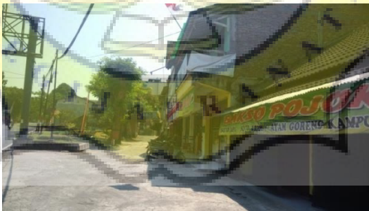
Gambar 4.6. Toko pada lingkungan sekitar tapak