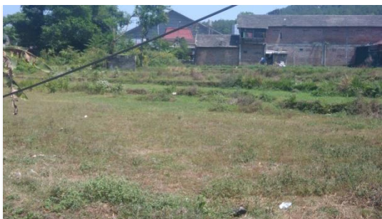
Gambar 4.1. area site tapak