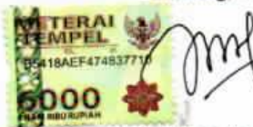
Muh. Safaat Agung Tubagus 15.C2.0044