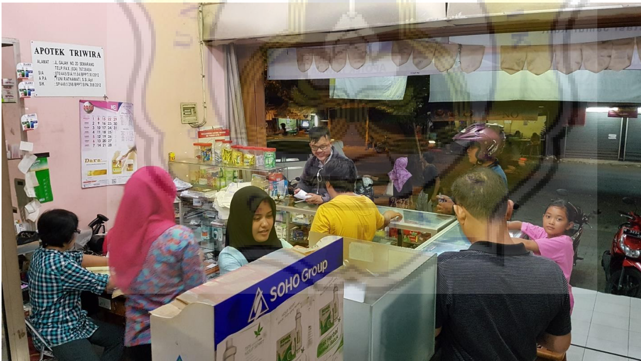
Asisten apoteker sedang memasukkan data penjualan dan memberi uang kembalian