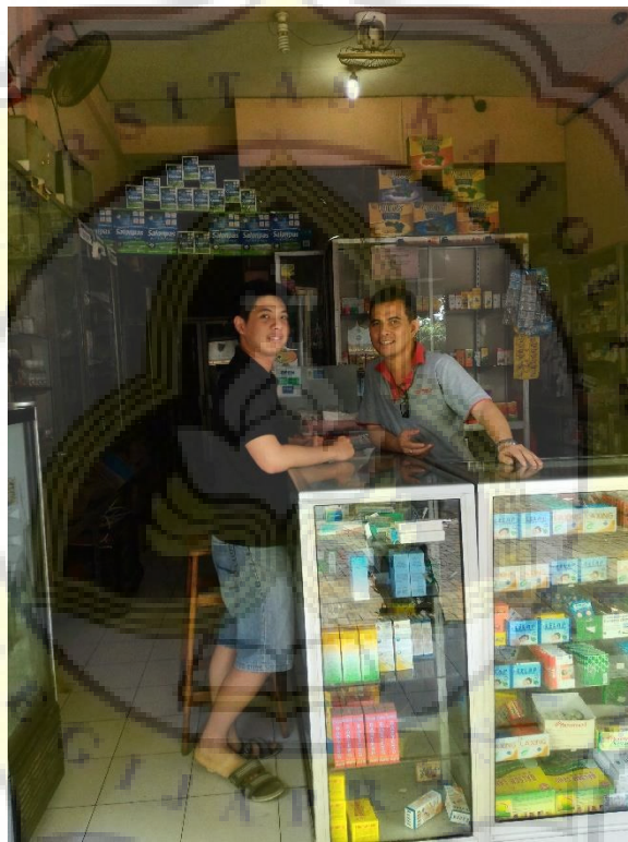
Wawancara dengan pemilik apotik