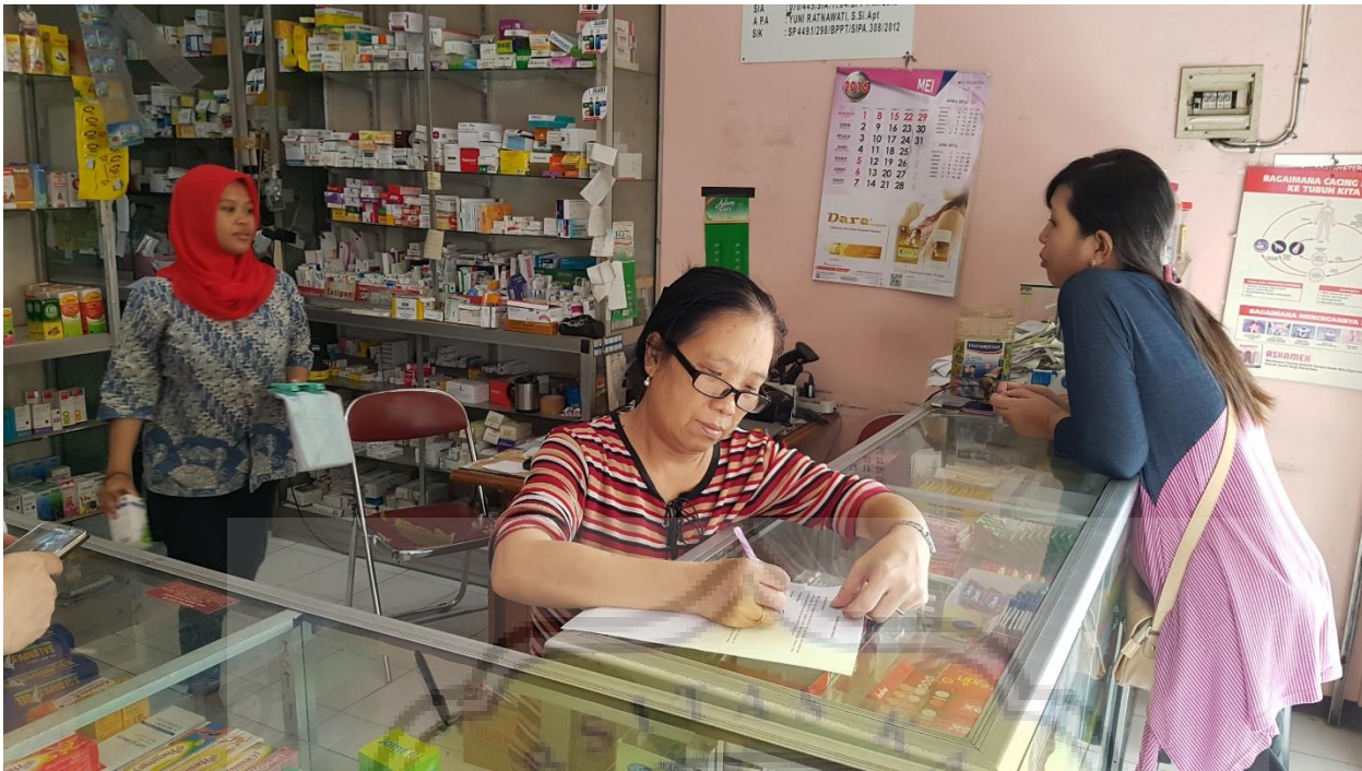
Pengisian Kuesioner oleh karyawan apotik Triwira