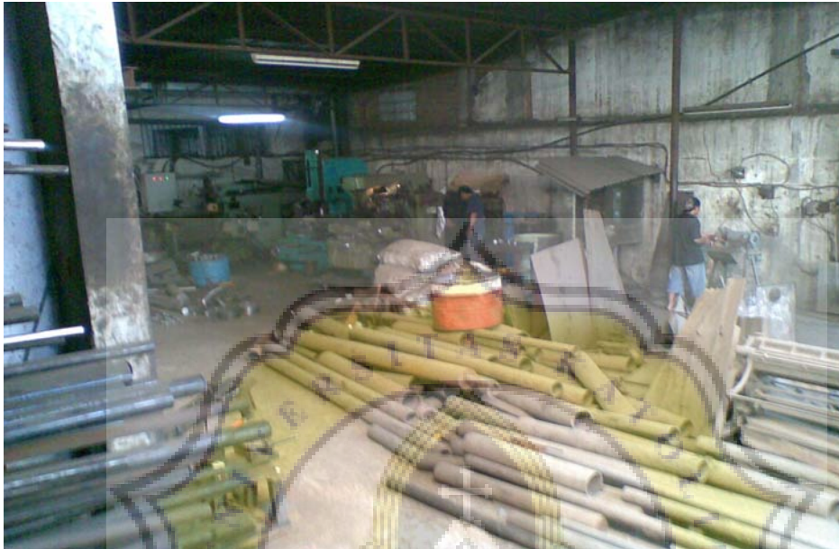
Gambar 8. Foto di BSS