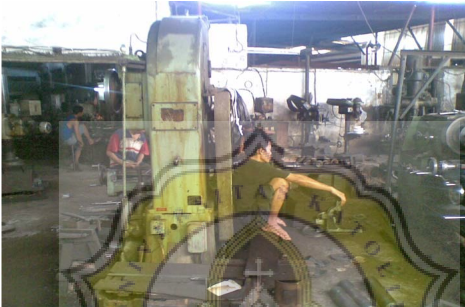
Gambar 6. Foto di BSS