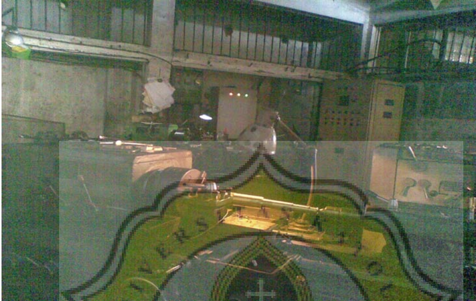
Gambar 4. Foto di BSS