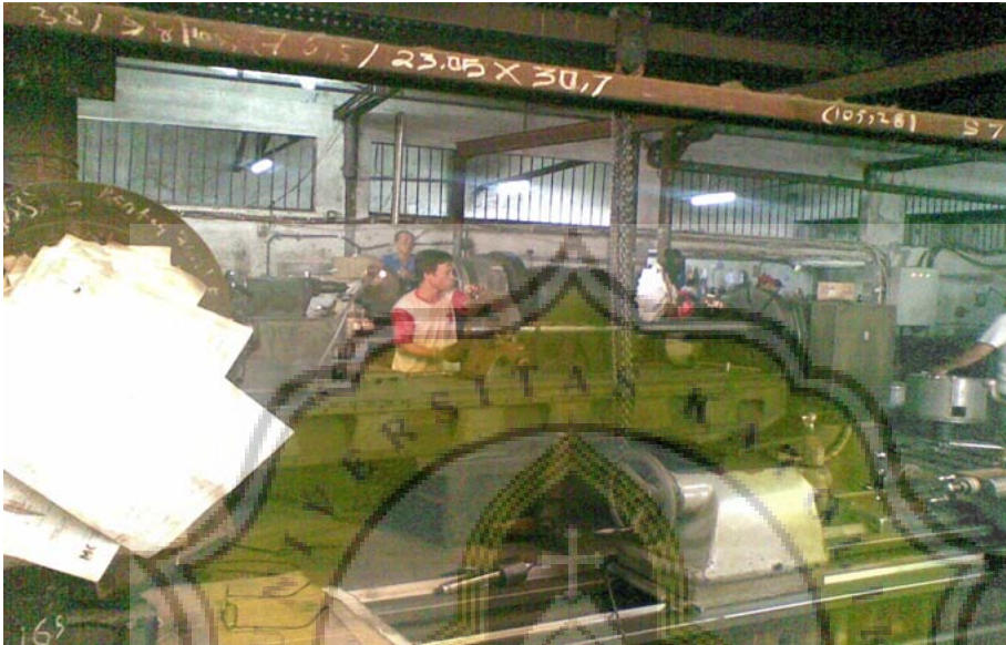
Gambar 2. Foto di BSS