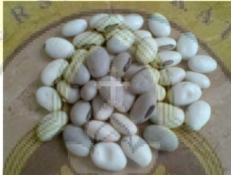
Gambar 3 . Biji Koro Pedang ( Canavalia ensiformis [L.] DC) ( http://www.google.com )

Secara botani tanaman koro pedang dibedakan dalam dua tipe tanaman yaitu koro pedang yang tumbuh tegak berbiji putih ( Canavalia ensiformis [L.] DC) yang dikenal dengan nama Jackbean , dan koro pedang yang tumbuh merambat berbiji merah ( Canavalia gladiata ) yang dikenal dengan nama Swordbean . Tanaman koro pedang dapat tumbuh hingga ketinggian 2000 m d.p.l, tumbuh baik pada suhu rata-rata 14°C - 27°C di lahan tadah hujan atau 12°C - 32°C di daerah tropik dataran rendah. Sistem perakaran kedua tanaman tersebut sangat dalam, sehingga dapat menjangkau persediaan kadar air tanah yang cukup pada kondisi permukaan tanah kering atau pada lahan kering. Pertumbuhan kedua jenis tanaman koro pedang tersebut dapat optimal bila mendapatkan sinar matahari secara cukup (Anonim, 2008a).