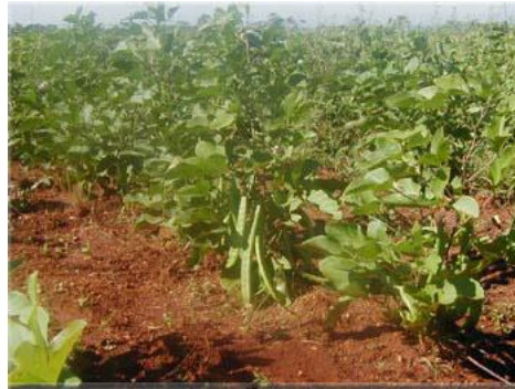
Gambar 2 . Tanaman Koro Pedang ( Canavalia ensiformis [L.] DC)