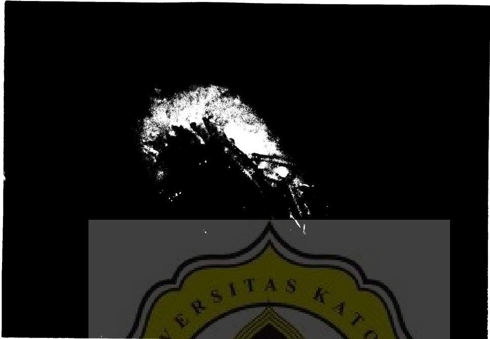
Udang ( Penaeus merguensis ) *