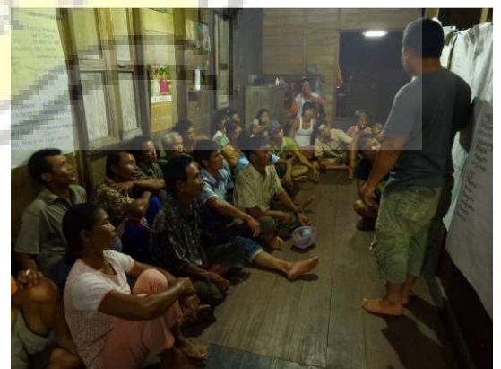
Temu Warga Desa Tumbang Koroi untuk menyampaikan hasil FGD