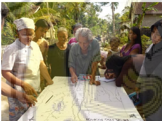
FGD Pemilik Lahan di Desa Tumbang Koroi