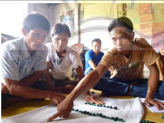
FGD Perangkat Desa di Desa Tumbang Koroi