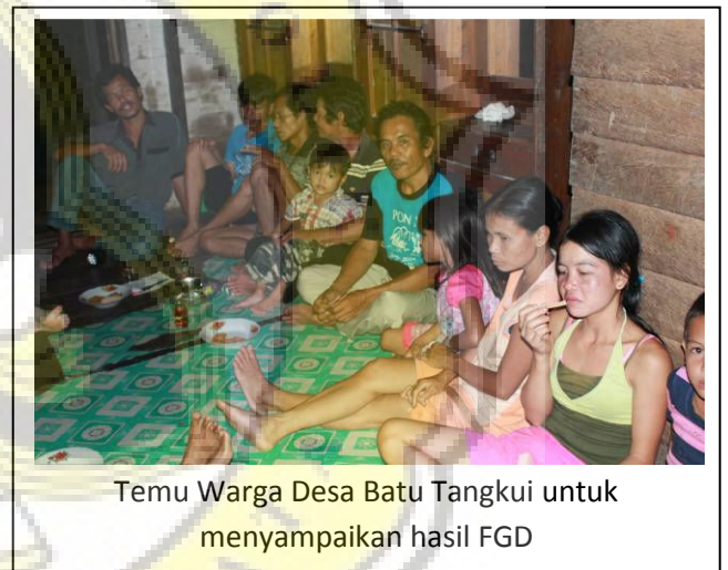
Temu Warga Desa Batu Tangkui untuk menyampaikan hasil FGD