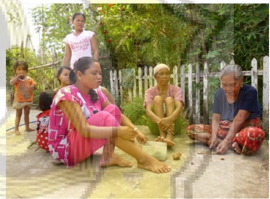
FGD Bukan Pemilik Lahan di Desa Tumbang Koroi