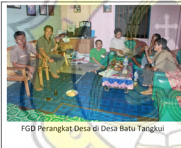
FGD Perangkat Desa di Desa Batu Tangkui