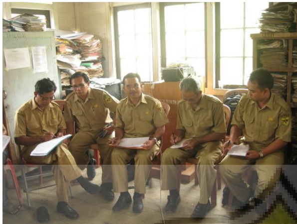
FGD Perangkat Desa di Desa Karetan Sarian