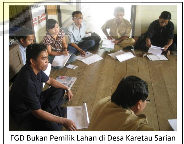
FGD Bukan Pemilik Lahan di Desa Karetan Sarian