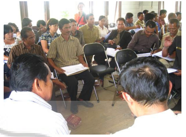
Temu Warga Desa Karetan Sarian untuk menyampaikan hasil FGD