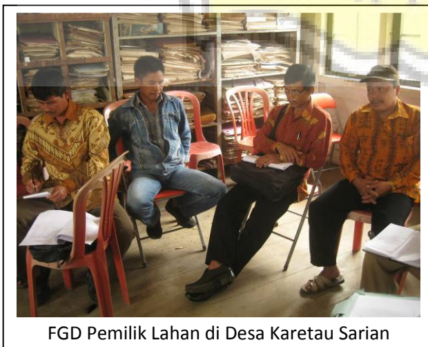
FGD Pemilik Lahan di Desa Karetan Sarian