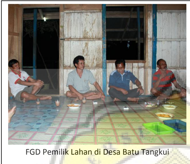
FGD Pemilik Lahan di Desa Batu Tangkui