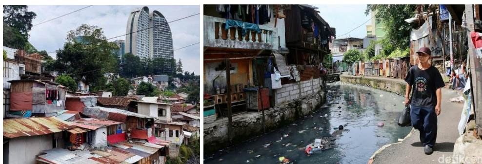
Gambar 1. Gambaran Isu Sosiospasial Permukiman di Indonesia (Bandung, Jakarta)

Konsep sosiospasial menjelaskan keterhubungan antara praktik sosial, relasi kekuasaan, dan struktur spasial dalam membentuk pola-pola kehidupan masyarakat di dalam ruang, baik secara fisik maupun simbolik (Aminah, 2015). Dalam konteks permukiman, sosiospasial membantu kita memahami bagaimana aspek-aspek sosial, seperti praktik, aktivitas, makna, dan interaksi manusia, saling terkait dan terwujud dalam dimensi spasial, seperti tata ruang, bentuk, dan karakteristik fisik lingkungan permukiman (Mulyadi & Liauw, 2020). Permukiman di Indonesia memiliki kompleksitas yang unik, terkait dengan sejarah pembentukan, latar belakang sosial-budaya penghuninya, serta interaksi dengan konteks lokal yang beragam (Mardian & Mandaka, 2022). Kompleksitas ini diwujudkan dalam pola-pola, praktik, dan aktivitas masyarakat dalam menggunakan dan memaknai ruang serta tempat tinggal mereka. Berbagai isu sosiospasial yang seringkali muncul di permukiman di Indonesia mencakup, misalnya, makna dan kearifan lokal dalam penataan lingkungan, praktik sosial dan interaksi warga, serta hubungan antara aspek fisik dan non-fisik permukiman.