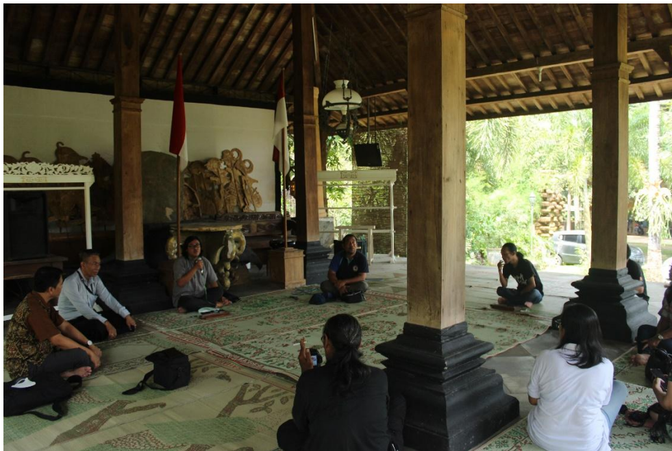
Gambar 4. Foto Foto Suasana Diskusi tim FBS dan RKBRR