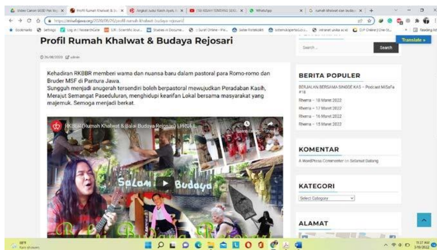
Gambar 1. Profil RKBBR ( https://misafajava.org/2020/08/26/profil-rumah-khalwat-budaya-rejosari/ )

Sejauh ini RKBBR telah mencoba mengkomunikasikan kepada publik profil, kegiatan dan karya- karyanya melalui dua akun. Untuk profil RKBBR dapat dilihat pada https://misafajava.org/2020/08/26/profil-rumah-khalwat-budaya-rejosari/ . Sementara itu untuk kegiatan/aktivitas RKBBR dapat diketahui melaluikanal YouTube: https://www.youtube.com/hashtag/rkbbbr .