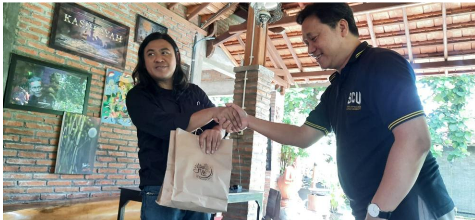
Gambar 2. Foto Wakil Tim FBS Berjabat Tangan dengan Wakil Tim dari RKBBR

Dokumentasi Kegiatan PkM di RKBBR Kudus.