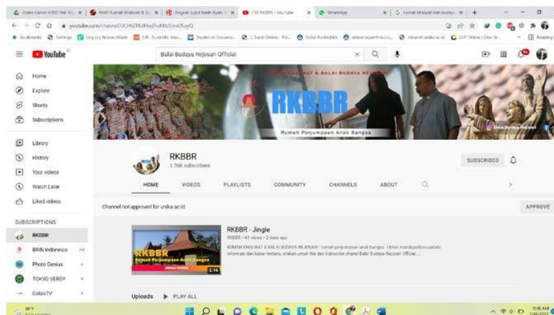
Gambar 2. Kegiatan RKBBR ( https://www.youtube.com/hashtag/rkbbbr )