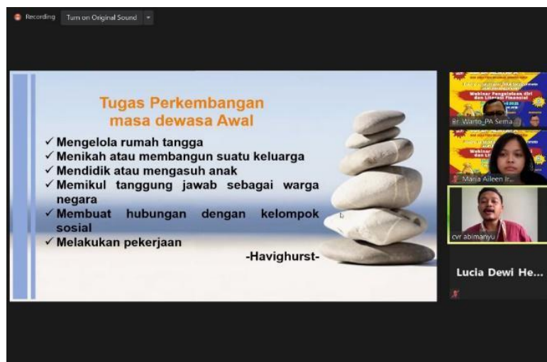
Gambar 3. Pemaparan Materi Narasumber 3