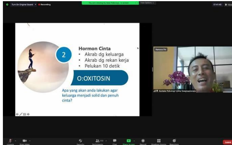
Gambar 2. Pemaparan Materi Narasumber 2