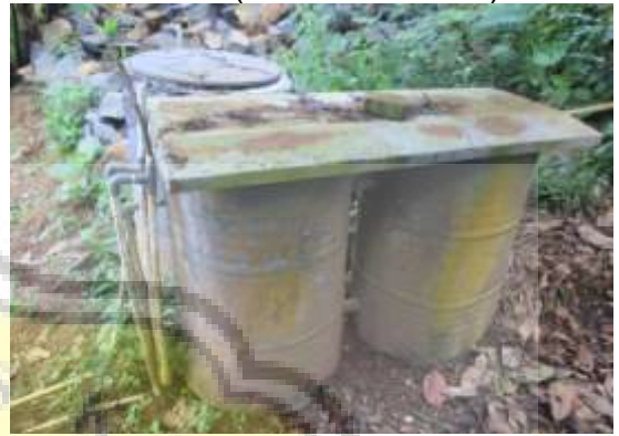
Sistem Pembagian Ke SR (Saluran Rumah)