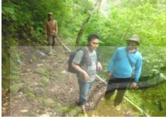
Wawancara di Lapangan