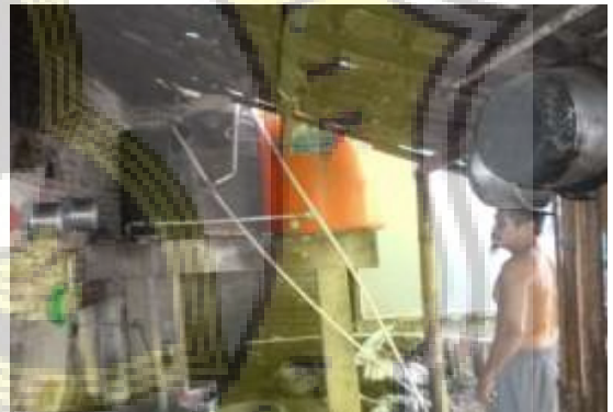
Penampungan Air Di Rumah