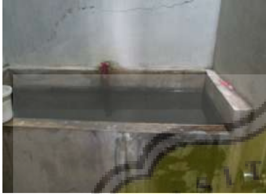
Penggunaan Air Untuk Mandi