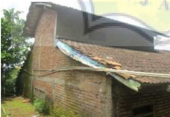
Rangkaian Pipa Di Sekitar Rumah