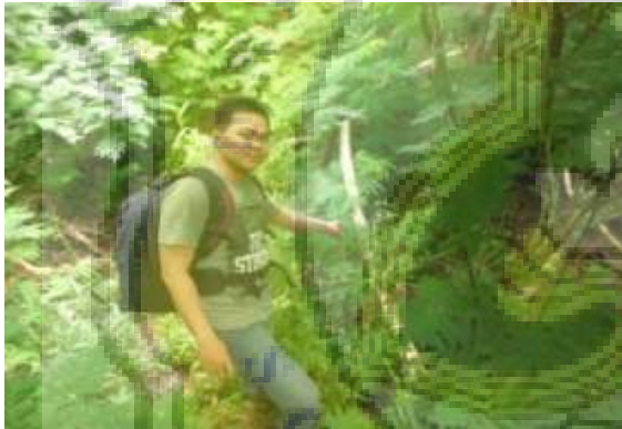
Rangkaian Pipa Saluran Air Di Hutan