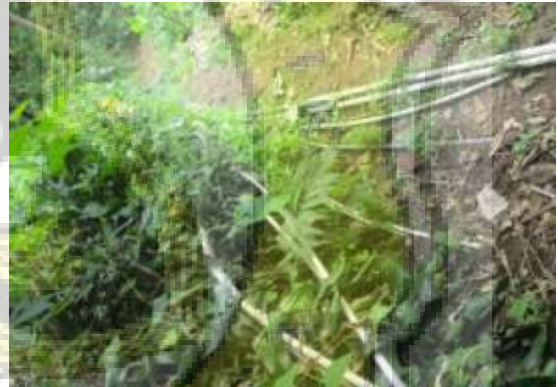
Rangkaian Pipa Di Jalan Setapak