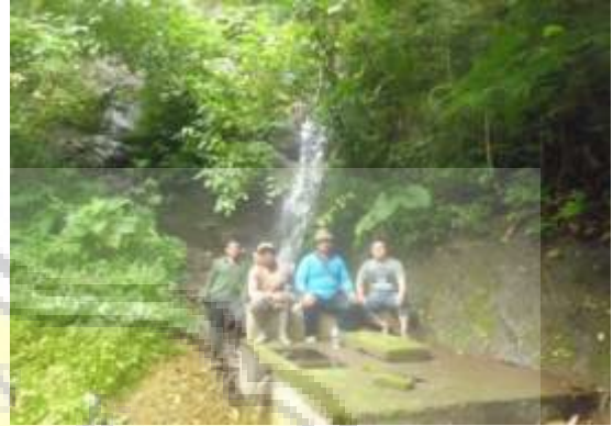
Di Sumber Mata Air Bersama Subyek