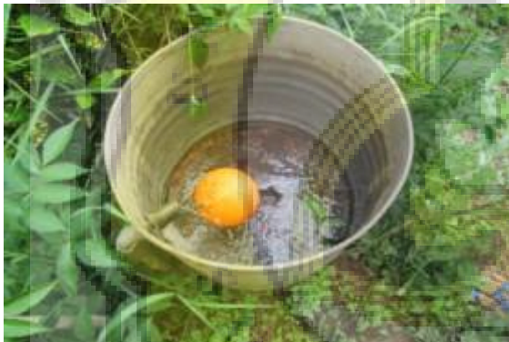
Bak Pembagian Ke Bak Penampungan Sementara