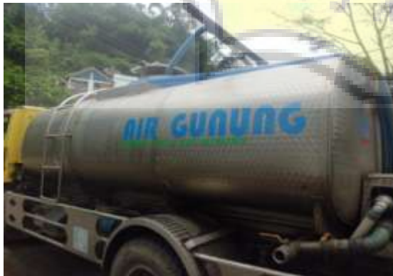
Salah Satu Mobil Tangki Subyek