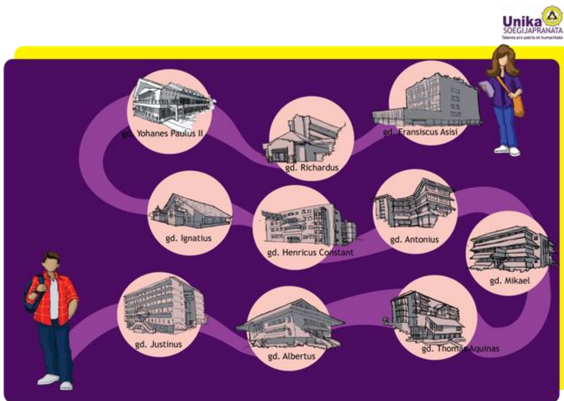
Gambar 1. Saat titik sudah terlewati