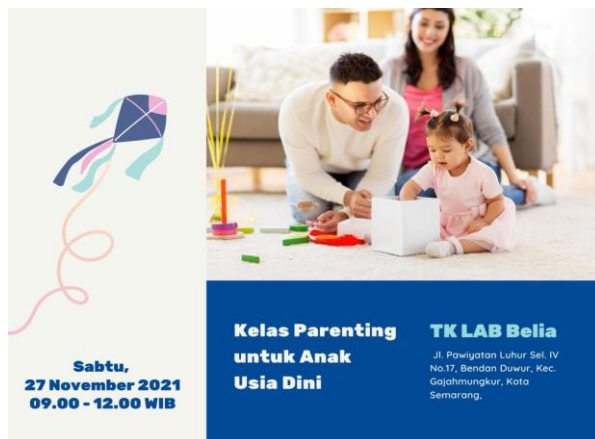
Gambar 2. Flyer Kegiatan

Dalam kegiatan bermain 11 orang ibu menjawab bahwa anak mandiri dalam bermain dan membereskan mainannya sendiri setelah bermain, tentu saja dengan pengawasan dari ibu. Kemandirian berani berpendapat juga sudah cukup baik yaitu semua anak berani berpendapat mengutarakan keinginannya walaupun belum sempurna. Strategi meningkatkan kemandirian anak usia dini yang diterapkan orangtua adalah dengan menggunakan reward , orangtua juga menggunakan penguatan terhadap perilaku yang muncul pada anak, Penguatan tersebut seperti pujian terhadap perilaku yang sudah tepat yang dilakukan anak