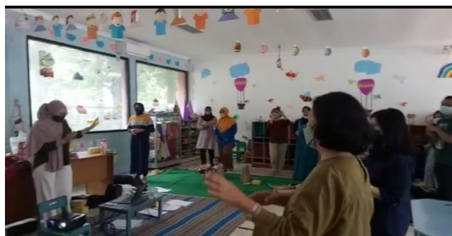
Gambar 4. Sesi Pembukaan