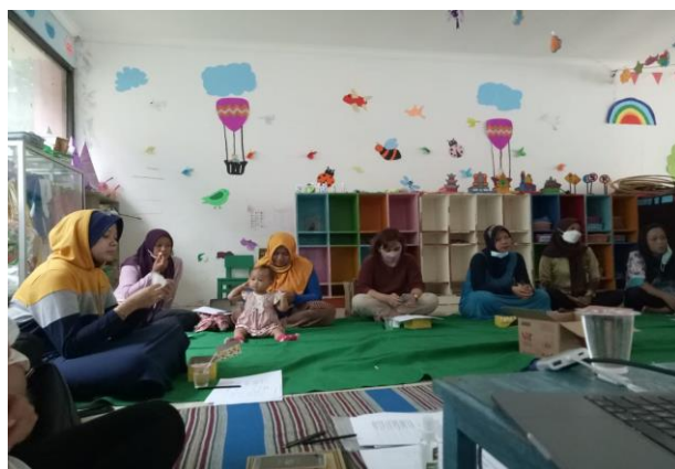
Gambar 3. sesi pelatihan