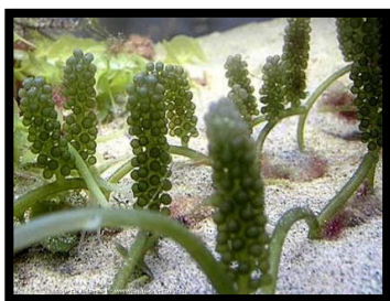
Gambar 1. Rumput Laut Caulerpa lentilifera

typhimurium (FNCC 0050), Nutrient Broth (NB), Nutrient Agar (NA), Muller Hinton Agar (MHA), etil asetat, etanol 96% dan dimethylsulphoxide (DMSO). Alat dan instrumen yang digunakan dalam penelitian ini adalah Vacuum Rotary Evaporator (BUCHI, model R-200), mikropipet, spektrofotometer (UV-VIS 1240), shaker (STUART-FRANCE, model SSL 1), cabinet dryer (Mettler), laminar air flow hood , autoklaf, kertas saring Whatman no 1, cawan petri, kertas cakram steril (Whatman).