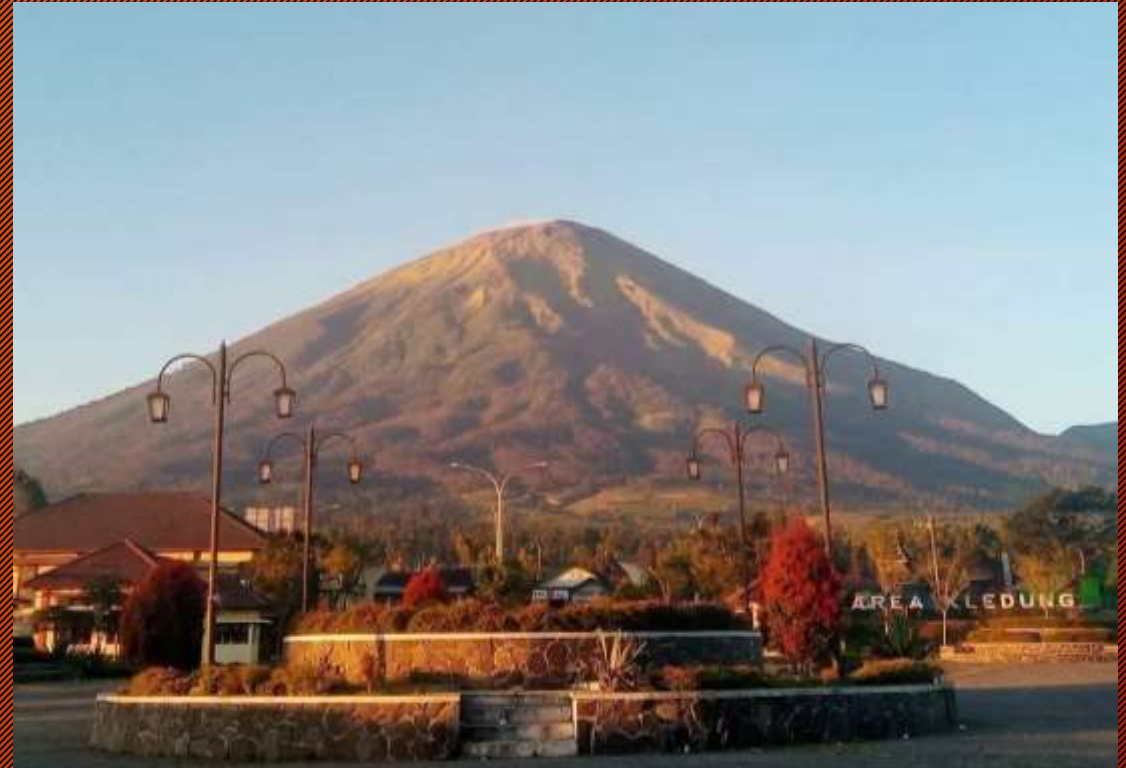
Rest area Kledung di Temanggung, menuju Wonosobo, Jawa Tengah