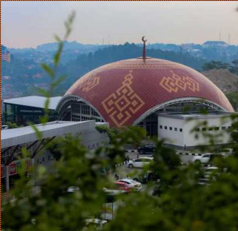
Rest area KM 22 tol Semarang-Solo, Ungaran, Jawa Tengah

Untuk mengetahui pola konsumsi pengunjung di rest area jalan tol.