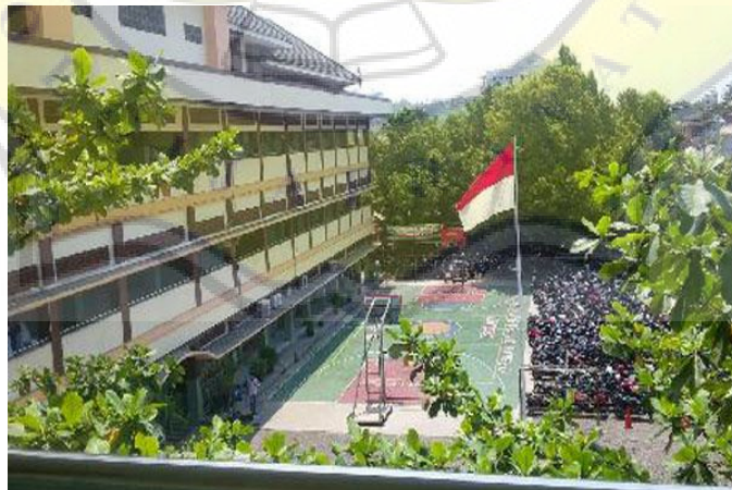
Gambar 4.1 Suasana sekolah SMA Islam Sultan Agung 1 Semarang

SMA Islam Sultan Agung 1 Semarang merupakan salah satu Sekolah Menengah Atas swasta di Kota Semarang yang berdiri pada tanggal 2 Januari 1966. SMA Islam Sultan Agung 1 Semarang beralamat di Jl. Mataram No. 657 Kota Semarang. SMA Islam Sultan Agung 1 Semarang merupakan sekolah swasta berakreditasi A yang mengedepankan hal-hal islami yang dinaungi oleh Yayasan Badan Wakaf Sultan Agung Semarang. Saat tahun ajaran 2016/2017 SMA Islam Sultan Agung 1 Semarang telah menggunakan basis Kurikulum Nasional K13 ( Kurikulum 2013 ). Saat ini SMA Islam Sultan Agung 1 Semarang memiliki 1043 siswa dengan jumlah total kelas sebanyak 35 kelas, 63 guru, 225 mata pelajaran, 4 jurusan dan 17 ekstrakurikuler.