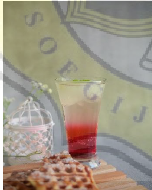
Gambar 1. 5 Menu Sibutter.id