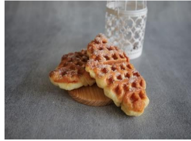
Gambar 1. 3 Menu Sibutter.id