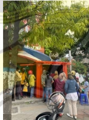
Gambar 1. 4 Menu Sibutter.id

Pada 3 bulan pertama, Sibuter.id menghasilkan keuntungan yang bisa di bilang cukup besar untuk di kalangan UMKM. Namun, seiring berjalannya waktu, keuntungan yang di hasilkan sibutter semakin mengalami penurunan. Berikut