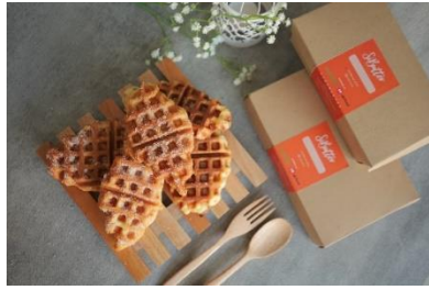
Gambar 1. 2 Menu Sibutter.id