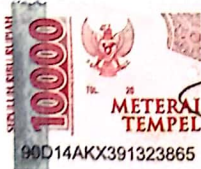
Yuli Setiyowati 18.B1.0045