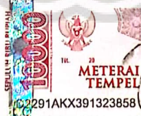
Lilis Suryawati 18.B1.0094