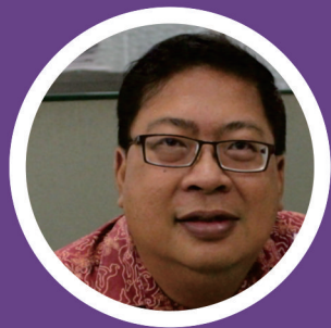
Prof. Dr.-Ing. L.M.F. Purwanto Program Studi Doktor Arsitektur konsentrasi Arsitektur Digital Unika Soegijapranata Semarang

Media Zoom akan dibagikan setelah pendaftaran dan menjelang acara berlangsung Biaya Rp 25k utk e-sertifikat