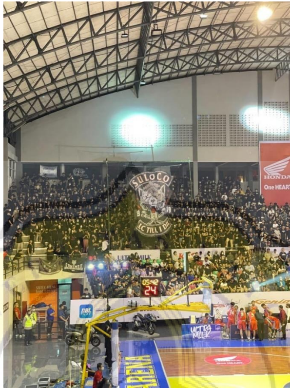
Kelompok gabungan suporter Kolese saat mendukung tim Loyola bertanding pada event DBL di Gor Sritex Solo