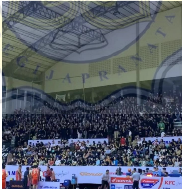
Kelompok gabungan suporter Kolese saat mendukung tim Loyola bertanding pada event DBL di Gor Sritex Solo