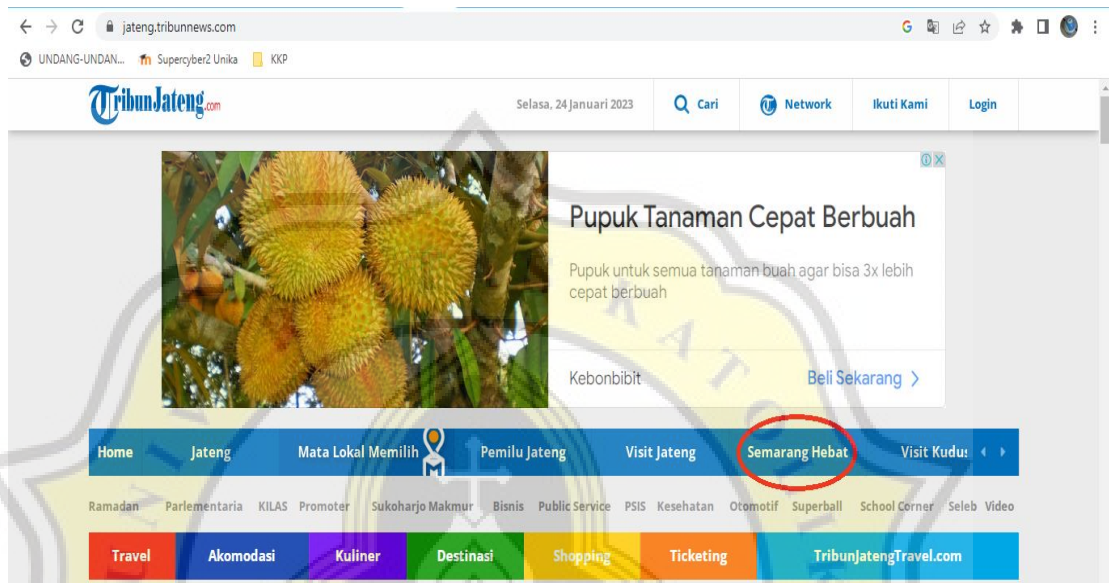
Gambar 4.2 Rubrik “Semarang Hebat”