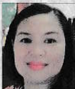
Oleh: DR Widuri Kurniasari SE M.Si

Jika ada utang baik, maka ada juga yang namanya utang buruk. Utang buruk artinya adalah jika