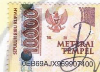
Tan Bella Yulia Guntar