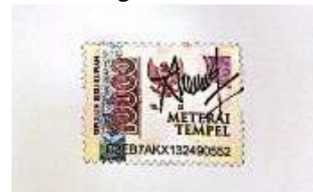
Ailene Laretta Angela 18.D1.0011