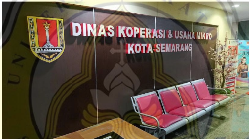
Gambar 4.1 Dinas Koperasi Kota Semarang

Dinas Koperasi Kota Semarang terletak di Jalan Pemuda No. 214, Dinas Koperasi merupakan salah satu organisasi pemerintah yang menjalankan urusan pemerintah di bidang Koperasi. Tugas Dinas Koperasi Kota Semarang melaksanakan urusan pemerintah daerah di bidang Koperasi berdasarkan asas otonomi dan tugas pembantuan oleh kepala daerah.