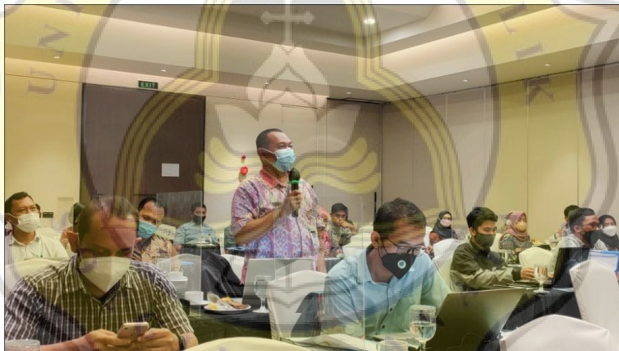
Gambar 4.6 Pelaksanaan Sosialisasi Update Data Mandiri Sistem Informasi Data Koperasi di Hotel Mahima Semarang