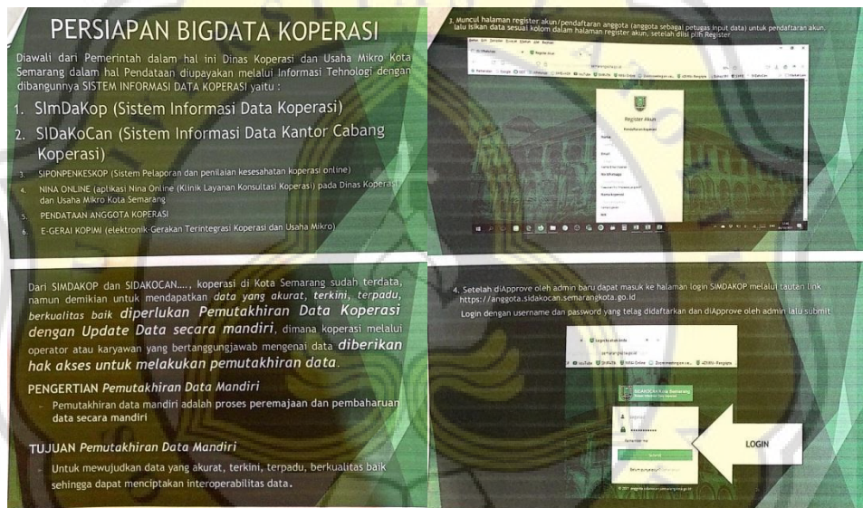
Gambar 4.5 Pesan Sosialisasi Data Koperasi

Namun dalam mengatur dan menempatkan kalimat yang dimuat dalam power point terlalu banyak, sehingga poin pesan yang ingin disampaikan tidak dapat dipahami dengan sempurna. Berikut isi pesan berupa power point yang telah disiapkan oleh Dinas Koperasi Kota Semarang: