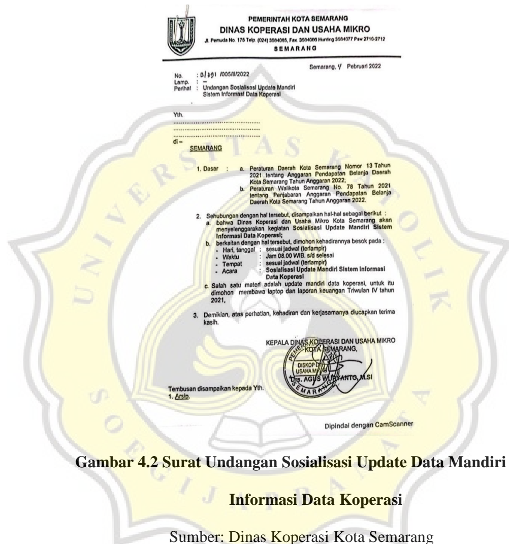
Gambar 4.2 Surat Undangan Sosialisasi Update Data Mandiri Sistem Informasi Data Koperasi

Mandiri Sistem Informasi Data Koperasi yang didapatkan selama proses penelitian: