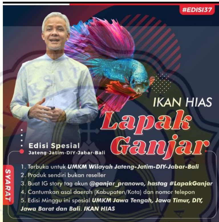
Gambar 4.2 Tangkapan Layar Lapak Ganjar

beberapa engagement, untuk mengetahui informasi omset yang didapatkan. (wawancara, lampiran 3). Adapun tampilan konten Lapak Ganjar seperti pada gambar 4.2 dibawah ini.