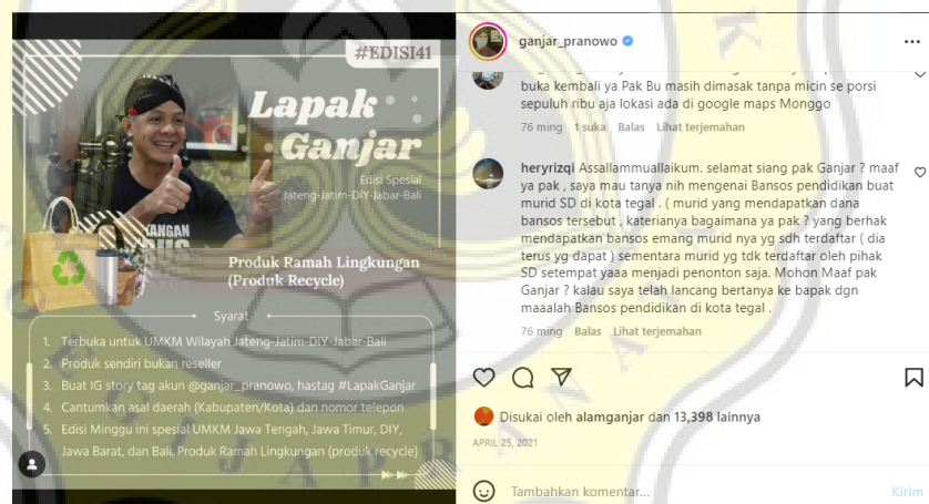
Gambar 4.7 Tangkapan Layar Komentar Lapak Ganjar

Komentar yang terdapat di konten Lapak Ganjar tidak hanya komentar yang berkaitan dengan konten yang di unggah. Peneliti sering menemukan komentar yang tidak ada hubungannya dengan Lapak Ganjar. Biasanya berupa keluhan-keluhan ataupun pertanyaan dari masyarakat akan hal lain seperti pada gambar 4.7.