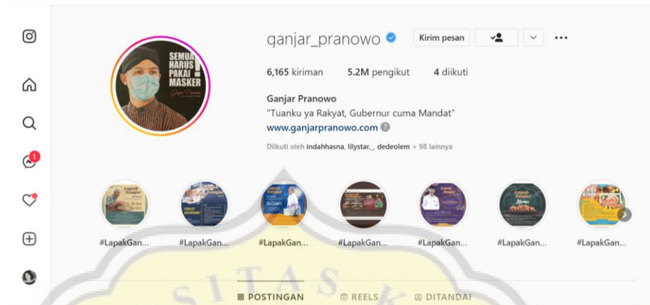
Gambar 4.10 Story Highlight Lapak Ganjar