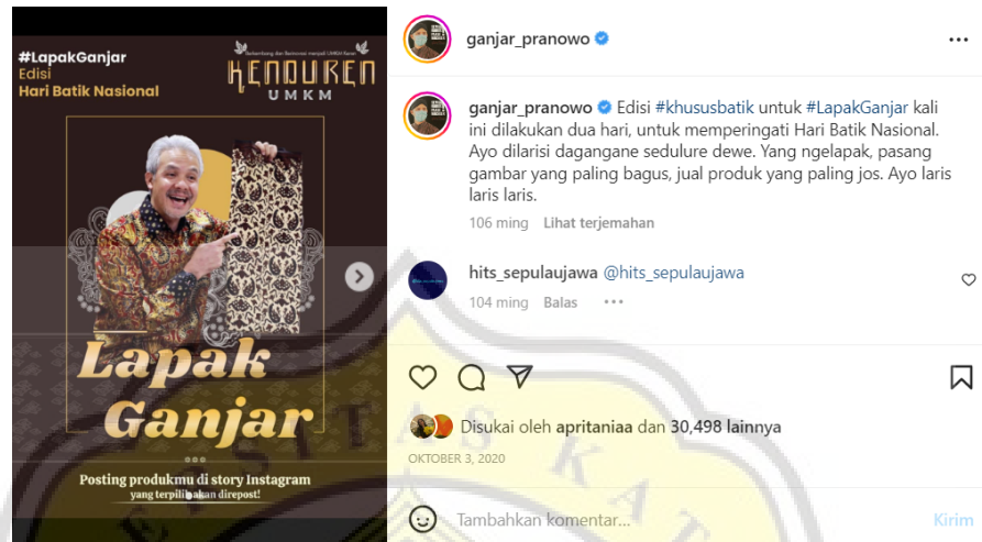
Gambar 4.4 Lepak Ganjar Edisi Hari Batik Nasional