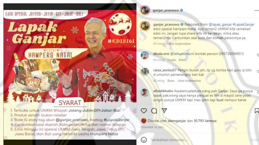
Gambar 4.8 Feed Post Lapak Ganjar

Pada feed post Ganjar Pranowo mengunggah konten Lapak Ganjar berupa gambar yang berisikan foto ganjar, foto produk, serta kalimat penjelas edisi dan syarat. Selain itu dalam feed post selalu disertakan caption.