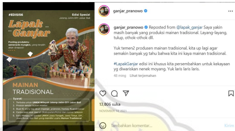
Gambar 4.5 Lapak Ganjar Edisi Mainan Tradisional