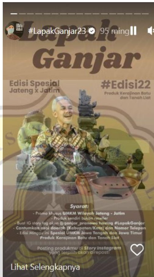
Gambar 4.9 Story Lapak Ganjar