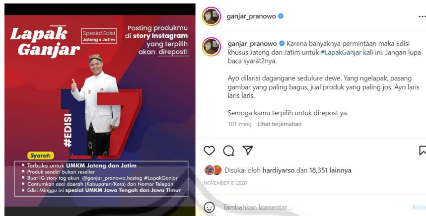
Gambar 4.11 Lapak Ganjar Edisi 17

Unggahan tanggal 8 November 2020 yang terdapat dalam Gambar 4.11 merupakan contoh unggahan di Lapak Ganjar yang menggunakan bahasa Jawa pada kata dagangane sedulure dewe yang berarti dagangan saudara sendiri dan kata produk yang paling jos yang berarti produk yang paling bagus. Selain itu peneliti juga menemukan bahasa Jawa yang digunakan pada unggahan tanggal 23 Januari 2021 terdapat kata dodolan maneh , yang berarti berjualan lagi.