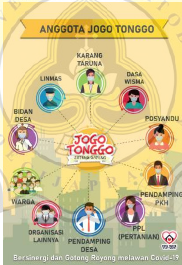
Gambar 4.3 Anggota yang berperan dalam Jogo Tonggo

Ganjar Pranowo membuat program yang dibuat dalam rangka penanganan Covid-19 yang bernama “Jogo Tonggo” merupakan salah satu bentuk strategi politik berupa menciptakan kebersamaan dengan khalayak. Pada program ini, Ganjar Pranowo menekankan pesan tentang peran dan juga keikutsertaan masyarakat terhadap penanganan covid-19 di Jawa Tengah. Konsep program ini berlandaskan prinsip gotong royong yang mana melibatkan semua pihak seperti Rukun Warga (RW), yang setiap RW harus membentuk satgas Jogo Tonggo diwilayahnya masing-masing.