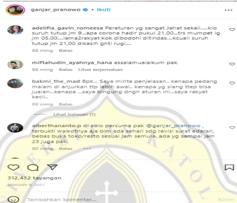
Gambar 4.5 Contoh Komentar Kritikan Pada Postingan PPKM