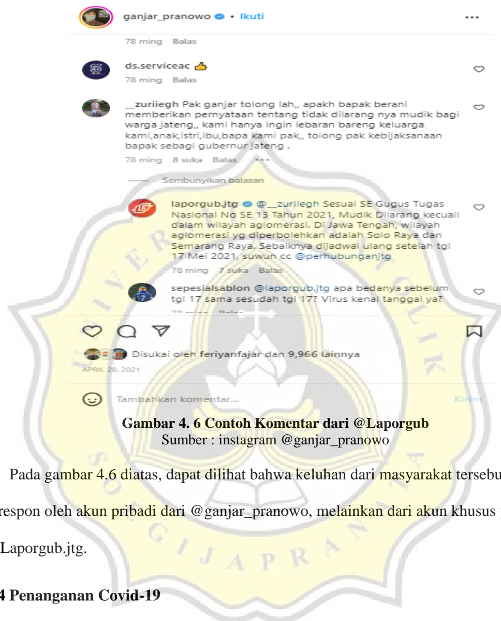
Gambar 4. 6 Contoh Komentar dari @Laporgub

Pada gambar 4.6 diatas, dapat dilihat bahwa keluhan dari masyarakat tersebut tidak direspon oleh akun pribadi dari @ganjar_pranowo, melainkan dari akun khusus yaitu @Laporgub.jtg.