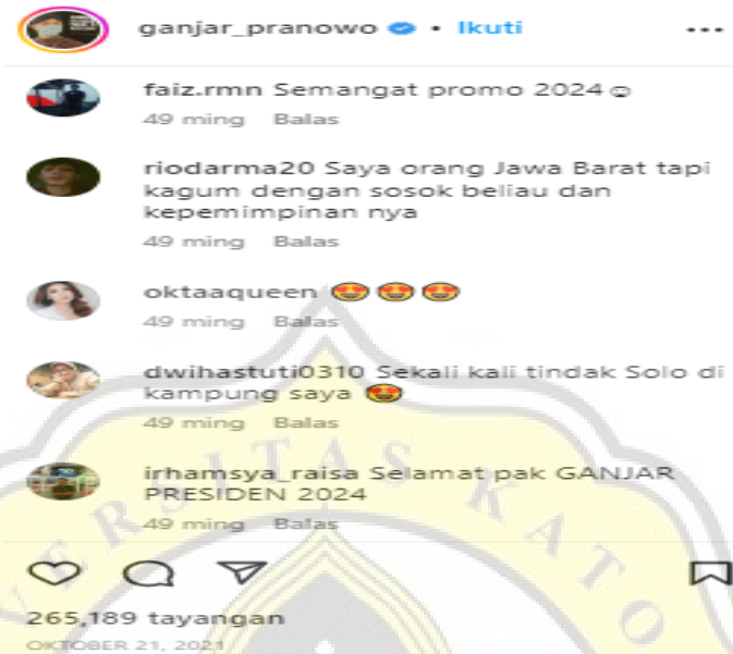
Gambar 4.4 Contoh Komentar Pada Postingan Instagram @ganjar_pranowo

Pada isi komentar dari unggahan akun Instagram @ganjar_pranowo, rata-rata lebih dominan ke dukungan Ganjar untuk maju menjadi presiden ditahun 2024. Hal ini dikarenakan semakin dekatnya pilpres yang akan dilakukan pada tahun 2024 yang mana masyarakat banyak yang menginginkan Ganjar maju sebagai kandidat.