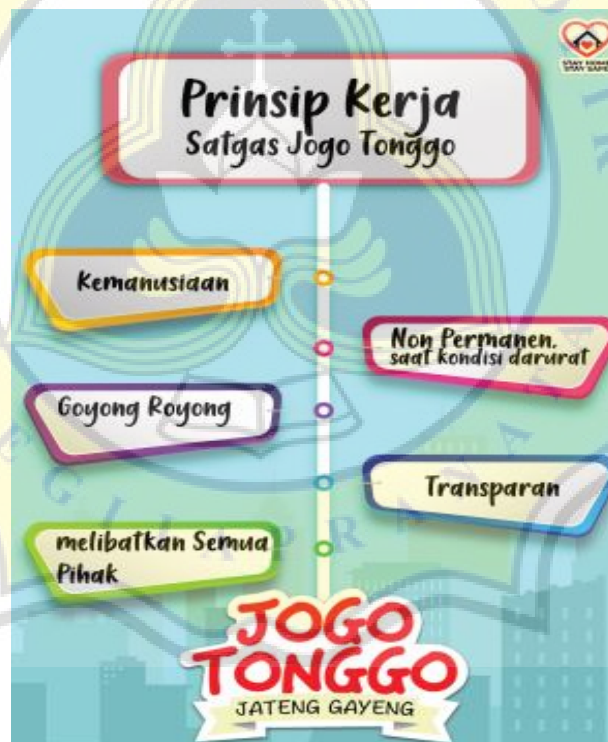
Gambar 4.2 Prinsip Program Jogo Tonggo

Pada tabel 4.6 di atas, merupakan bentuk unggahan yang menerapkan strategi menciptakan kebersamaan dengan khalayak dari sub tema Jogo Tonggo. Pada sub tema ini, Ganjar Pranowo menunjukkan kebersamaanya dengan warga-warga desa mulai dari karang taruna, sampai penduduk-penduduk desa di setiap daerah. Tidak hanya itu, Ganjar Pranowo juga menunjukkan perhatiannya terhadap Santri-Santri dari berbagai ponpes di Jawa Tengah, seperti pada unggahan tanggal 14 September 2020 yang mana pada unggahan tersebut, Ganjar Pranowo melalui akun instagramnya @ganjar_pranowo mengadakan lomba Jogo Tonggo bagi ponpes di Jawa Tengah.