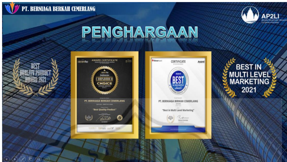
Gambar 1.2 Penghargaan yang Diterima PT. Berniaga Berkah Cemerlang

PT. Berniaga Berkah Cemerlang tidak menggunakan sistem deadline atau target dalam waktu tertentu, sehingga untuk mencapai posisi yang lebih tinggi bisa dilakukan dengan cepat atau lambat. Hal ini membuat para anggota bisa mencari poin atau anggota baru tanpa terpacu pada deadline target yang ditentukan perusahaan. Para anggota masih bisa melakukan aktivitas atau pekerjaan lain di luar menjualkan produk-produk dari PT. Berniaga Berkah Cemerlang. Ketika salah satu anggota tidak aktif, maka poin dan performa anggota tersebut tidak akan menurun.