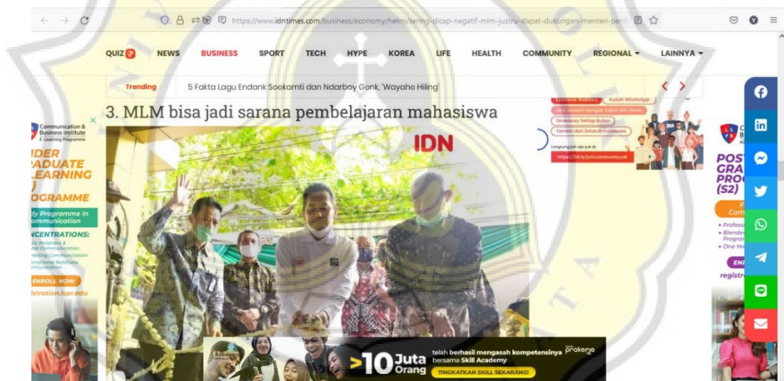
Gambar 1.1 Liputan IDN TIMES Mengenai Bisnis MLM

Menteri Perdagangan, Agus Suparmanto mengatakan bahwa bisnis MLM memberi kontribusi yang besar terhadap perekonomian nasional ( www.idntimes.com : 2020). Hasil survei yang dilakukan Kementerian Perdagangan menunjukkan bahwa bisnis MLM berguna sebagai wadah bagi pelajar dan mahasiswa dalam mengasah mental kewirausahaan. Adapun anggapan negatif masyarakat terhadap bisnis MLM yang saat ini menjadi tantangan bagi pendiri bisnis MLM. Para pendiri bisnis MLM harus bisa meyakinkan masyarakat agar mau bergabung dengan bisnis yang mereka dirikan.