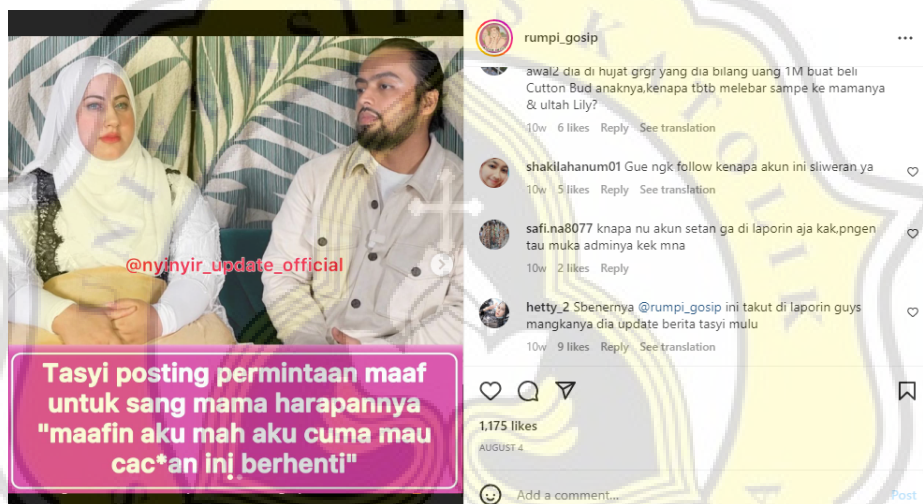
Gambar 4.11 Unggahan Melanggar Moralism Principle

Tak hanya pelanggaran dari netizen dalam kolom komentar saja, kini akun @rumpi_gosip juga ditemukan telah melanggar prinsip etika komunikasi dalam moralism principle yang ditunjukkan melalui teks berita di salah satu unggahan @rumpi_gosip. Berikut merupakan salah satu hasil dokumentasi dari berita gosip pada akun @rumpi_gosip yang telah melanggar moralism principle :