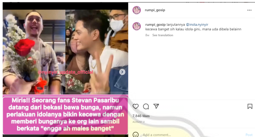
Gambar 4.6 Unggahan Melanggar Paternalism Principle

Berdasarkan unggahan di atas, teks berita yang disampaikan oleh akun @rumpi_gosip bertuliskan “ Miris! Seorang fans Stevan Pasaribu datang dari Bekasi bawa bunga, namun perlakuan idolanya bikin kecewa dengan memberi bunganya ke org lain sambil berkata “engga ah males banget!” ” Pernyataan tersebut sudah menimbulkan opini dalam berita hoax dengan melampirkan kata dari idola tersebut yaitu “ engga ah males banget! ”. Kemudian, akun @rumpi_gosip juga memberikan caption berupa “ Kecewa banget sih kalo idola gini, mana udah dibela-belain ”.