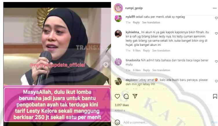
Gambar 4.9 Unggahan Melanggar Offense Principle

Contoh pelanggaran offense principle lainnya juga ditunjukkan dalam unggahan di bawah ini: