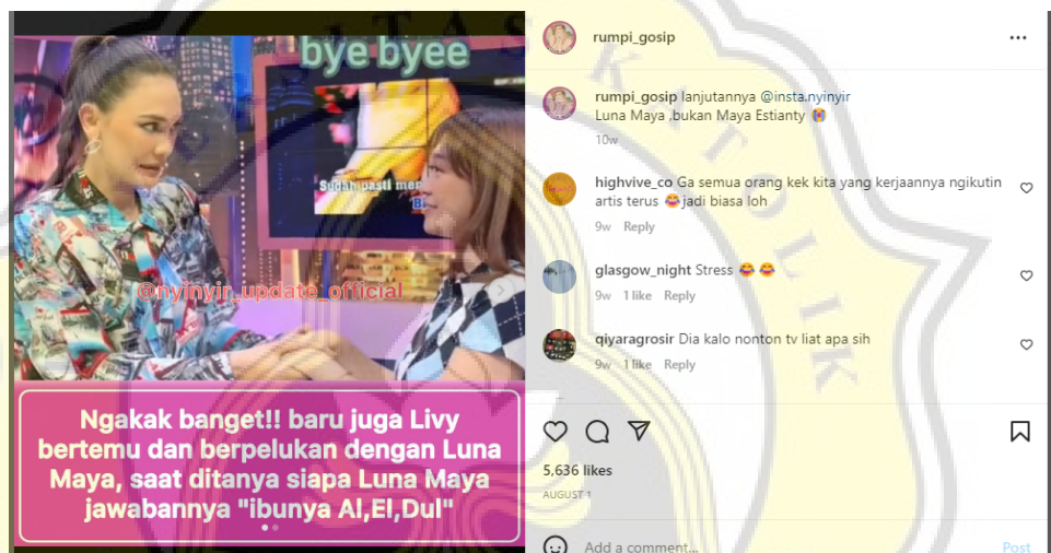
Gambar 4.4 Unggahan Melanggar Harm Principle

Hal lain terkait etika komunikasi dalam media sosial yang melanggar harm principle ditemukan pada unggahan lainnya di akun @rumpi_gosip. Pudarnya bahasa baku dalam menyampaikan pendapat juga dapat mengakibatkan kekerasan yang melewati batasan moral prinsip etika komunikasi. Berikut disampaikan salah satu contoh munculnya kekerasan dokumen atas pudarnya bahasa baku: