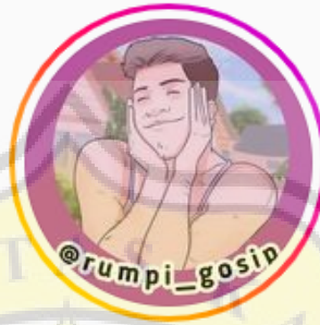
Gambar 4.1 Logo Akun @rumpi_gosip

Salah satu akun Instagram yang sedang populer terutama dalam membicarakan tentang dunia gosip adalah akun Instagram @rumpi_gosip. Akun ini berisikan informasi-informasi pada kehidupan para selebriti dan pada hal-hal yang sedang viral (ramai diperbincangkan) oleh khalayak. Akun @rumpi_gosip memiliki tagline “Gosip Terupdate” dengan pengikut lebih dari 390.000.