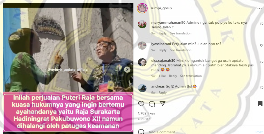
Gambar 4.3 Unggahan Melanggar Harm Principle

Dampak negatif dalam kekerasan etika komunikasi yang melanggar harm principle (kebebasan dibatasi untuk mencegah hal-hal yang menyakiti orang lain) terdapat pada unggahan pada tanggal 1 Agustus 2022. Pelanggaran harm principle yang ditunjukkan dalam akun @rumpi_gosip digunakan pada tiga hal seperti teks berita, caption , maupun komentar. Akun @rumpi_gosip menambahkan teks berita pada foto unggahan mengenai perjuangan puteri raja yang ingin bertemu ayahanda. Berikut merupakan hasil screenshot unggahan tersebut: