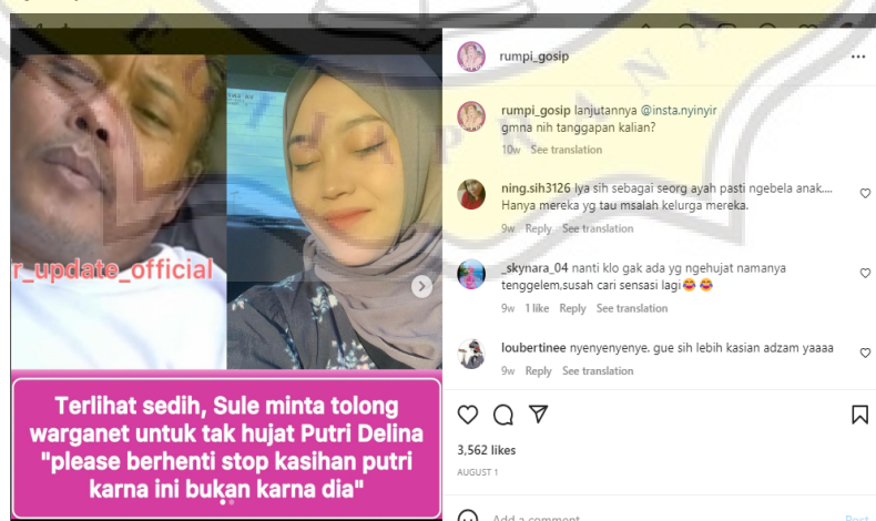
Gambar 4.8 Unggahan Melanggar Offense Principle

Dalam salah satu unggahan di akun @rumpi_gossip, ditemukan adanya pelanggaran prinsip etika komunikasi yaitu berupa offense principle , yang menimbulkan dampak negatif seperti memicu kecemasan dan meningkatkan depresi, khususnya bagi selebriti yang diangkat kedalam sebuah media. Pelanggaran ini ditunjukkan dalam komentar-komentar/penyampaian pendapat dari para netizen yang terdapat pada unggahan di akun @rumpi_gossip tanggal 1 Agustus 2022: