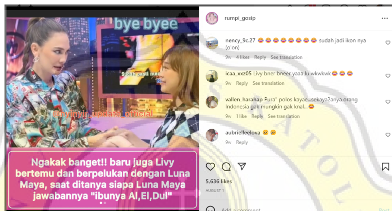
Gambar 4.5 Unggahan Melanggar Harm Principle

Akan tetapi, pada gambar 4.4 dengan total 327 komentar, ditemukan bahwa mayoritas komunikasi memberikan komentar yang melewati batasan moral dalam prinsip etika komunikasi. Beberapa cuplikan komentar tersebut berhasil ditangkap dalam dokumentasi seperti pada gambar di bawah ini: