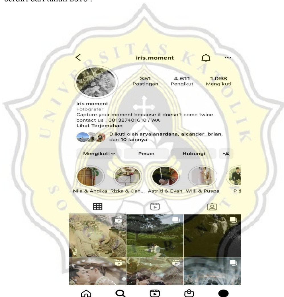
Gambar 4.1.1 Profil

Tidak hanya bekerja sendiri, Iris Moment juga bekerja sama dengan vendor maupun event organizer untuk menunjukkan bahwa memiliki hasil yang dapat memuaskan klien sekaligus untuk memperkenalkan dan melambungkan nama Iris Moment agar masyarakat terutama Semarang mengenal rumah produksi yang telah berdiri dari tahun 2016 .