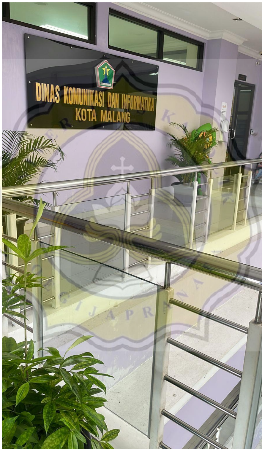
Lampiran 4. Foto Kantor Dinas Komunikasi dan Informatika Kota Malang