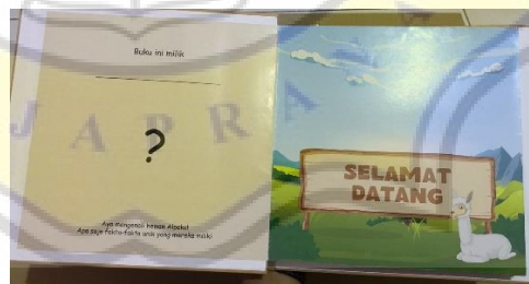
Gambar 4. 4 Halaman Pembuka

Buku cerita interaktif yang dibuat akan ada beberapa jenis aktivitas interaktif diantaranya: