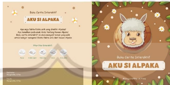
Gambar 4. 1 Sampul Buku