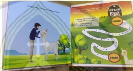
Gambar 4. 9 Participation

Pada halaman ini jenis interaktif yang digunakan yaitu Sticker book yang berisi ajakan dan perintah untuk mengumpulkan kawan-an Alpaka disellipkan fakta-fakta dari Alpaka.