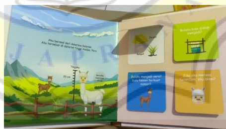
Gambar 4. 7 Peek a boo/Lift the flap

Pada halaman ketiga mulai masuki topik fakta-fakta dari Alpaka dengan jenis interaktif Hidden book , disini anak diajak untuk mencari hewan yang bersembunyi.