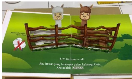
Gambar 4. 5 Pop Up

Pada halaman kedua berisi ajakan untuk mengenal fakta-fakta hewan Alpaka dengan jenis interaktif Pop up book yang dimana menampilkan gambar secara 3D.