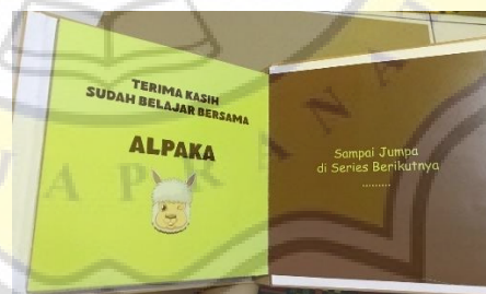
Gambar 4. 10 Halaman Penutup

Pada halaman ini jenis interaktif yang terakhir adalah Participation book yang berisi ajakan dan perintah untuk mengisi titik-titik tersebut.