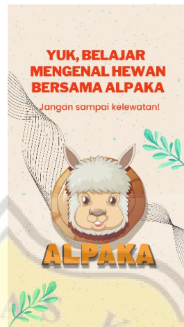
Gambar 4. 11 Screenshot Video Iklan

Ini adalah tampilan scene dari video iklan instagram dan TikTok untuk media pendukung.