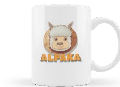
Gambar 4. 13 Mockup Gelas