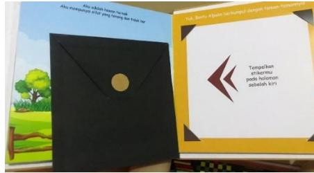
Gambar 4. 8 Sticker

Pada halaman ini jenis interaktif yang digunakan yaitu Sticker book yang berisi ajakan dan perintah untuk mengumpulkan kawan-an Alpaka disellipkan fakta-fakta dari Alpaka.