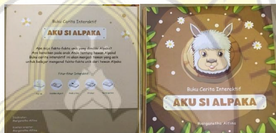
Gambar 4. 2 Sampul Buku Fisik