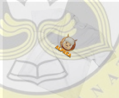
Gambar 4. 12 Mockup Baju