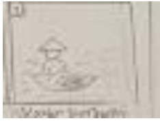
Gambar 4.4 cerita 2

Menggambarkan tentang para nelayan yang mendapatkan hasil penangkapan yaitu kebanyakan mendapat ikan tenggiri, dimana ikan ini merupakan bahan utama untuk membuat makanan tersebut.