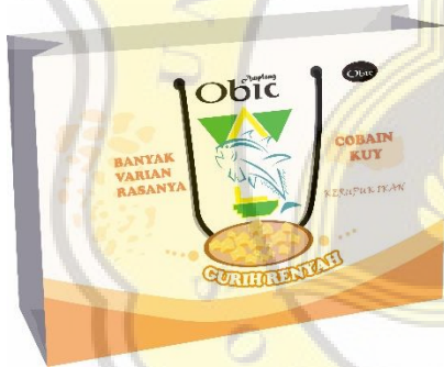
Gambar 4.10 Paper Bag