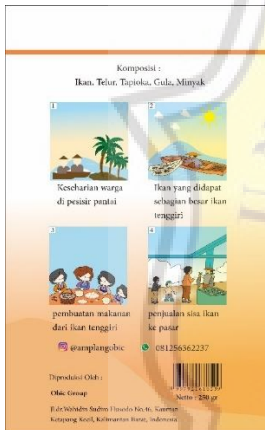
gambar 4.8 kemasan bagian belakang