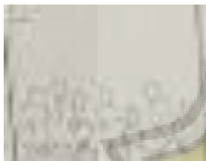
gambar 4.5 cerita 3

3. gambar yang ketiga berisi tentang para warga yang mengelola atau sedang membuat makanan yang terbuat dari ikan hasil tangkapan mereka.