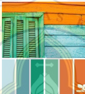
Gambar 4.1 Warna

Dalam perancangan kali ini akan menggunakan warna yang cenderung pastel dan juga terang karena ingin menyesuaikan dengan target sasaran yaitu anak muda dan membuat produk lebih terkesan kekinian. Warna yang akan digunakan adalah warna orange dimana warn aini merupakan warna khas dari toko obic dan juga warna hijau yang akan digunakan untuk menunjukkan kesan alami dan fresh dan juga warna biru agar menunjukkan kesan segar pada kemasan dimana pada bahan utama dari makanan ini adalah seekor hewan yang berasal dari air.