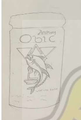
gambar 4.2 mock up kemasan