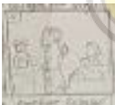
gambar 4.6 cerita 4

4. gambar keempat berisi tentang para nelayan atau warga menjual hasil tangkapan mereka kepasar serta menjualkan hasil olahan yang sudah diolah yang berupa kerupuk kepara pedagang.