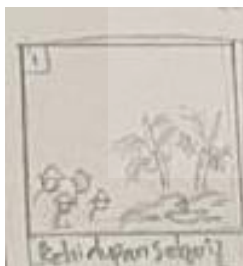
Gambar 4.3 cerita 1

Menggambarkan tentang kehidupan warga yang tinggal dipesisir pantai pada jaman dulu, dimana para warga yang tinggal dipesisir pantai bekerja sebagai nelayan untuk mencukupi kebutuhan hidup sehari-hari.