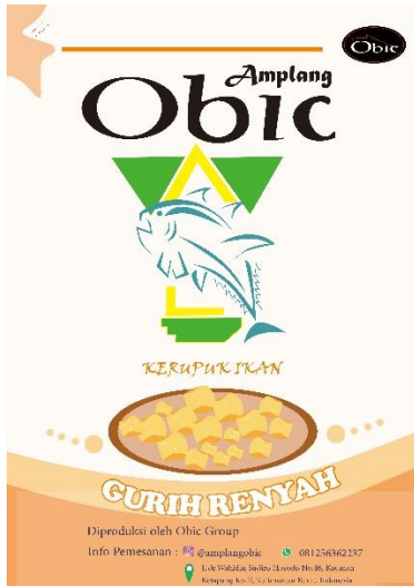
Gambar 4.9 Poster