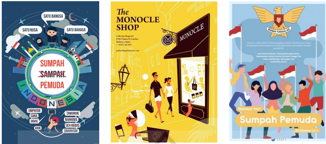
Gambar 8. Referensi Gaya Desain