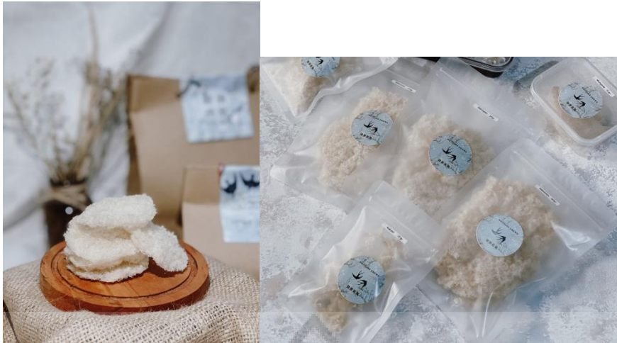
Gambar 4.1 Sarang Burung Walet Wellness Yanwo

Sarang burung walet ini setelah dicetak akan diberi packaging plastik klip seperti digambar, juga paperbag untuk membawanya.