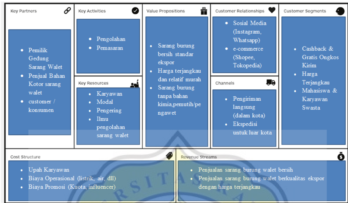
Gambar 4.3.1 BMC Wellness Yanwo