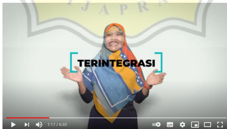
Gambar 1.3 Video PAUD Holistik Integratif di Youtube