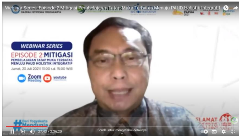
Gambar 1.1 Video PAUD Holistik Integratif di Youtube