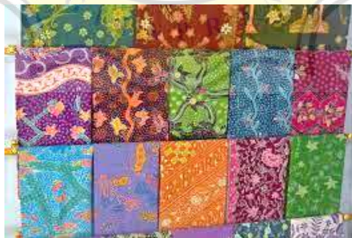
Kain Batik Motif Campuran