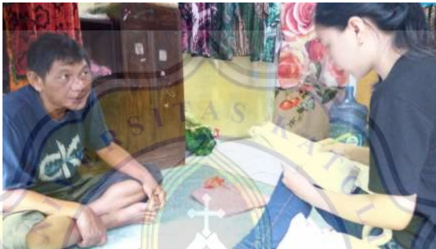
Pemilik Usaha Ono Batik