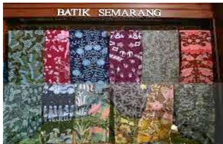
Kain Batik Semarangan