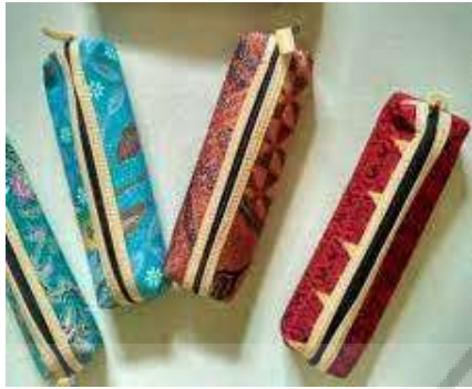
Tempat Pensil Batik