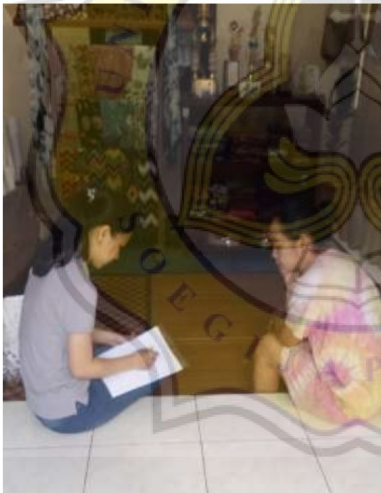
Pemilik Usaha Cinta Batik Semarang