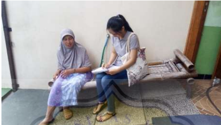
Pemilik Usaha Djago Batik