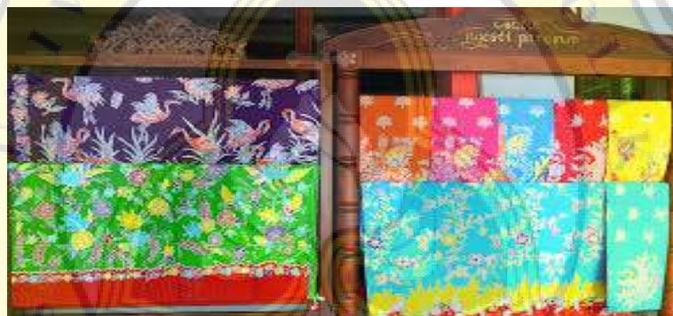
Kain Batik Motif Tumbuhan, Bunga dan Hewan