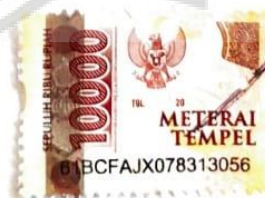
Nickolas Setia Budi