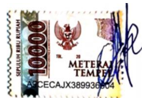
Wahyudi Budi Djatmiko