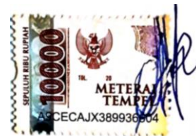
Wahyudi Budi Djatmiko