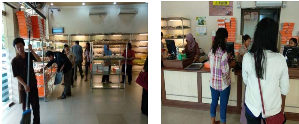
Gambar 2. Pelayanan di Virgin Cake & Bakery Tlogosari

Alasan berikutnya adalah pelayanan yang ramah mendapat 30,77%, pelayanan yang cepat 20%, dan pegawai yang tanggap 9,23%. Adapun pelayanan di Virgin Cake & Bakery 77 ini dapat dilihat pada gambar 2 .