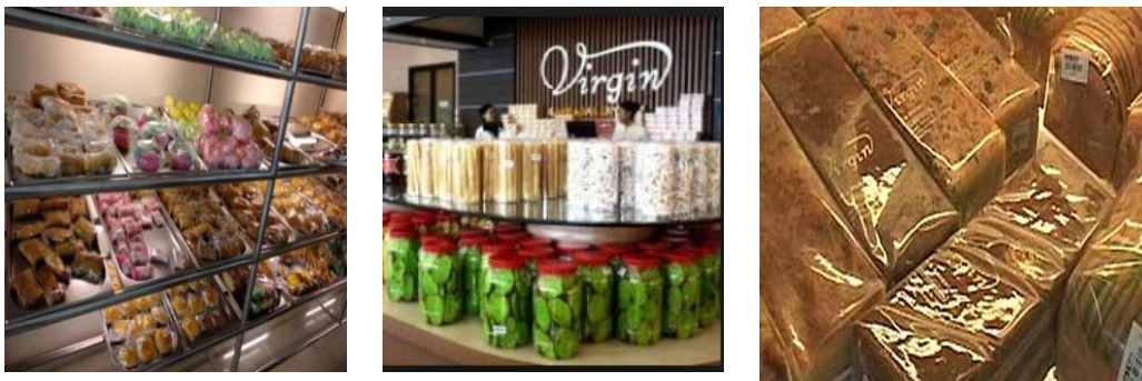
Gambar 1. Aneka Macam produk Virgin Cake & Bakery

faktor produk yang mempengaruhi konsumen adalah beraneka ragam jenis produknya dan produk selalu baru dari oven sehingga kualitas produk pun terjamin 20 Produk-produk andalan dari Virgin Cake & Bakery di antaranya, berbagai aneka jenis cake cheese cake, steam cake, dan banana cheese cake. Untuk jenis bakery terdapat roti cokelat kenari, roti sunny bun, roti telur kismis, roti keju manis, dan lain sebagainya. Sementara untuk jenis kue kering, antara lain seperti banana cookies, pumpkin cookies, kripik tempe cookies, dan ulat sutra. Sedangkan jenis kue tradisional yang paling banyak dicari adalah lumpia Hongkong, pastel basah, moaci, tahu bakso udang, arem kombinasi, resoles telur asin, dan wingko. Aneka ragam produk dari Virgin Cake & Bakery jga terlihat dari gambar 1 .