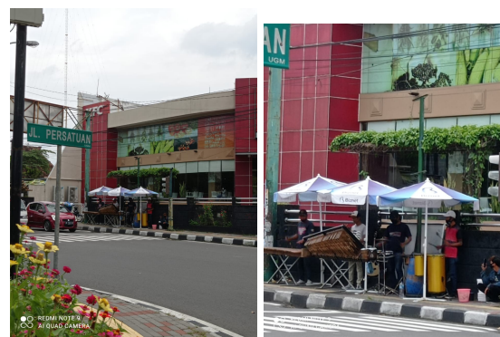
Gambar 4. Punklung di Jl. Persatuan (sekitar Mirota Kampus UGM, Yogyakarta). Dokumentasi Pribadi, Januari 2021

Biasanya kelompok seperti ini rela untuk bermain dibawah terik matahari. Jika nyari tempat untuk agak berteduh ya mencari lokasi yang ada pohonnya. Lain halnya dengan yang terlihat di gambar 4 ini, karena mereka mempunyai modal untuk bermain di bawah payung besar (lihat Gambar 4).