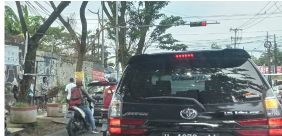
Gambar 5. Calung Punklung di Jl. Jenderal Pol Anton Sujarwo, Srandol (sekitar RS Hermina Banyumanik, Semarang)