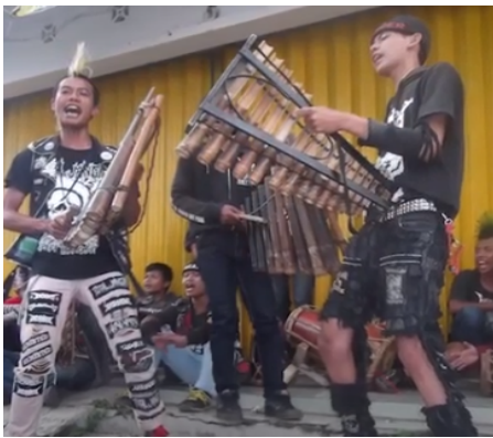
Gambar 2. Tampilan sebuah kelompok punklung dari Bandung, https://www.youtube.com/watch?v=avwshXh4gYc

pakaian jas kulit hitamnya selain ada tatoo di tangannya. Celana jeans yang ketat dimodifikasi dengan celana jeans yang disobek-sobek atau sekalian menjadi celana pendek yang bawahnya sengaja tidak dijahit secara rapi sehingga terlihat benang-benang yang mulai keluar dari celananya. Adanya ciri khas memakai sepatu boots ada yang mengikuti tren tersebut, tapi ada yang asal apakai alas kaki yang sekenanya (Dukut, 2020).