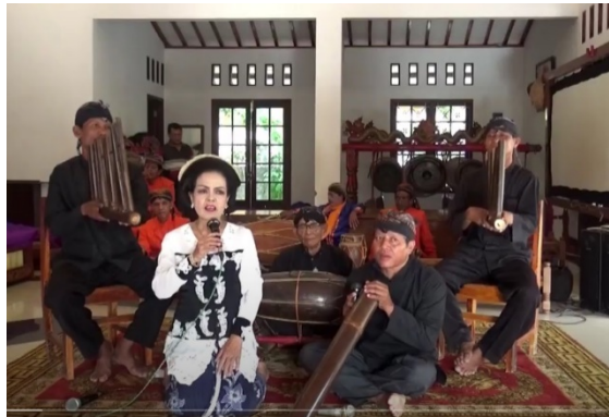
Tabel 1. Konversi Skala Tangga Nada Pentatonis Sunda ke dalam Sistem Skala Tangga Nada Barat